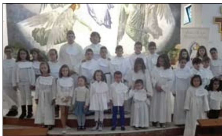
Niños celebrando Holywins en Mérida (arriba) y Pueblonuevo (abajo).