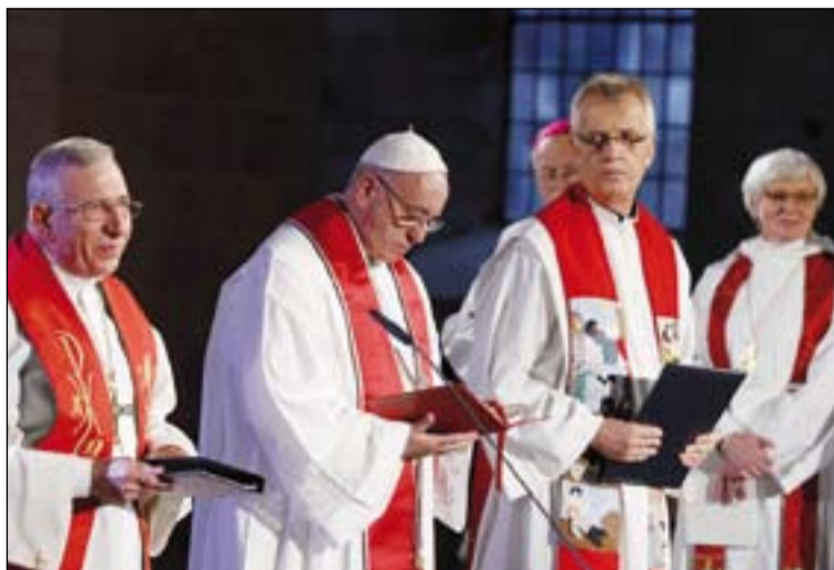
El Papa y, a su izda., el card. Martin Junge, sec. gral. de la Federación Luterana Mundial, en una oración en la catedral luterana de Lund (Suecia).

El Papa Francisco visitaba Suecia esta semana, una visita eminentemente ecuménica, que tenía como fondo el 500 aniversario de la Reforma Luterana, y que se realizaba por invitación del gobierno Sueco, de la Federación luterana mundial y por la Iglesia católica en Suecia