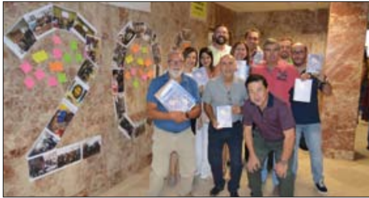
La comunidad educativa del colegio marista de Badajoz, volcado con la celebración.

Por este motivo, esta congregación tiene previsto realizar una serie de actos conmemorativos de este bicentenario, tanto a nivel internacional, nacional, autonómico y local. Para ello, en Los Maristas de Badajoz se constituyó el curso pasado una comisión compuesta por representantes de cada uno de los grupos y movimientos de toda la presencia marista en la ciudad, que ha planificado diversas actividades durante todo este curso escolar. La primera de ellas ha sido la