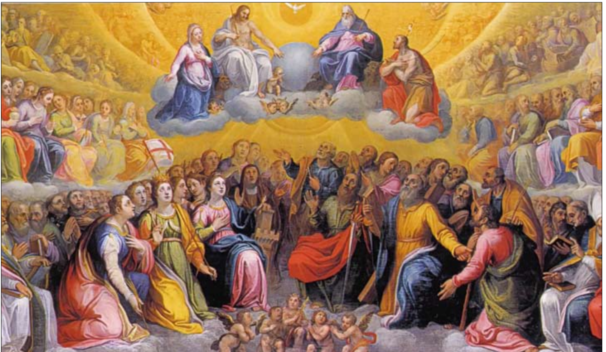
La Gloria de Todos los Santos. Lienzo de G. B. Ricci.