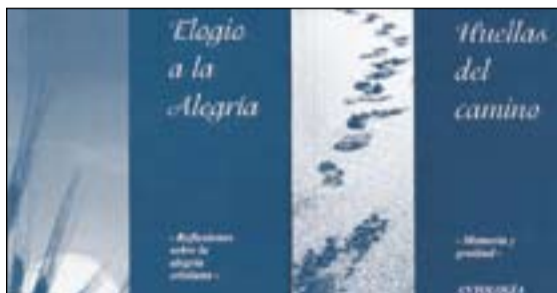
Portada de los dos libros de Antonio Bellido Almeida.

El primer libro se titula Huellas del camino, Memoria y gratitud ; es una antología poética de “su obra en verso” cuyo contenido reafirma en conjun-