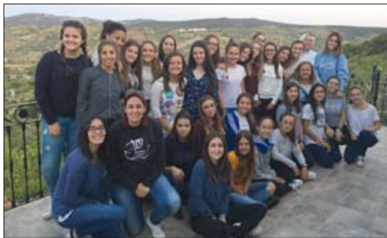
Jóvenes participantes en el proyecto Pozo de Jacob.

Los temas tratados han sido el acompañamiento y los itinerarios formativos de Pastoral juvenil. La experiencia diocesana será uno de los testimonios que tendrá el próximo encuentro.