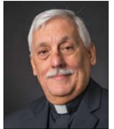
Católica Andrés Bello (1972) y doctor en Ciencias Políticas por la Universidad Central de Venezuela. ACI

El P. Sosa nació en Caracas (Venezuela) el 12 de noviembre de 1948, es consejero del padre General y delegado General para las casas y obras interprovinciales de la Compañía de Jesús en Roma. Es licenciado en Filosofía por la Universidad