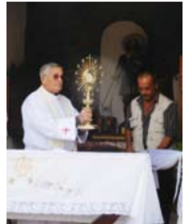
Momento de la Adoración Eucarística.

Por la tarde, fue el rezo del Santo Rosario y la Eucaristía, donde participaron diversos miembros de las secciones asistentes.