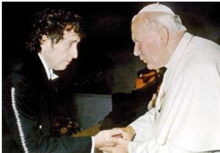
San Juan Pablo II y Bob Dylan.

Esta semana se han cumplido 38 años de la elección de San Juan Pablo II como Papa. Fue el 16 de octubre de 1978. La semana pasada sabíamos que el cantante Bob Dylan sería el nuevo Premio Nobel de Literatura. Hoy recordamos una anécdota que tiene a los dos como protagonistas