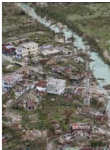
350.000 personas necesitan ayuda en Haití.

Cáritas ha abierto una cuenta en Ibercaja para ayudar al pueblo Haitiano. De momento Cáritas Española ha liberado ya 50.000 euros en ayuda de emergencia