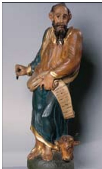
San Lucas, atribuido al taller de los Torres. Segunda mitad siglo XVI. Catedral de Badajoz.

Es patrono de los médicos y cirujanos, así como de