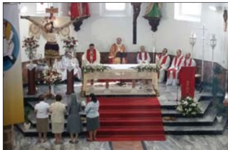
El Arzobispo presidió la Eucaristía del día 14.

El pasado 14 de septiembre, día de la Exaltación de la