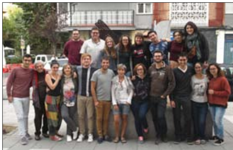
Miembros de la comisión general de JEC estatal.

Respecto a la militancia, se ha fijado como objetivo profundizar en la reflexión sobre el sentido de la militancia en el medio y ahondar en las motiva-