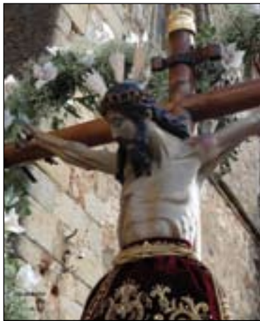
Cristo de la Misericordia.

El pasado 28 de agosto comenzaban los festejos programados con motivo del 150 aniversario de la Hermandad del Stmo. Cristo de las Misericordias, que se han prolongado hasta mediados de septiembre.