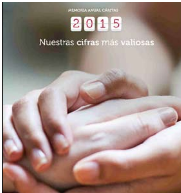
Portada de la Memoria anual de Cáritas española.

Gracias al compromiso de voluntarios, colaboradores y donantes, ha sido posible generar esperanza para muchas