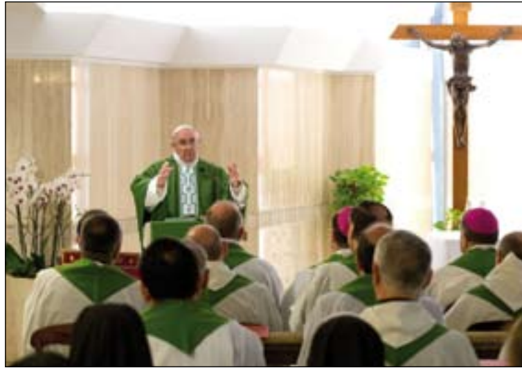
El Papa en la capilla de la residencia de Santa Marta.

En esta línea, el Pontífice ha explicado que "la desolación espiritual es algo que sucede a todos" y lo definió como "un estado del alma oscuro, sin esperanza, sospechoso, sin ganas de vivir, sin ver el final del túnel, con muchas agitaciones