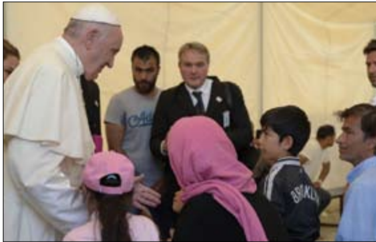
El Papa saluda a refugiados en su visita a Lesbos.

Absorberá los actuales Pontificio Consejo Cor Unum, Pontificio Consejo Justicia y Paz, así como el Pontificio Consejo para la Pastoral de los Emigrantes e Itinerantes y el Pontificio Consejo de la Pastoral para los Operadores Sanitarios