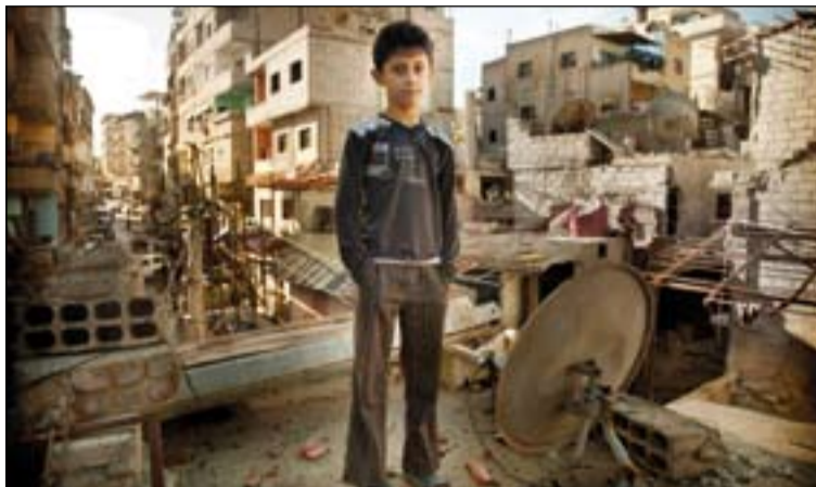
Niño cristiano en un tejado de Damasco (Siria).

En febrero de 2016, los países participantes en la conferencia Supporting Syria and the Region celebrada en Londres definieron un plan de trabajo ambicioso con el fin de responder a las necesidades humani-