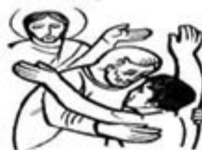
Parábola del hijo pródigo Lc 15,11-32