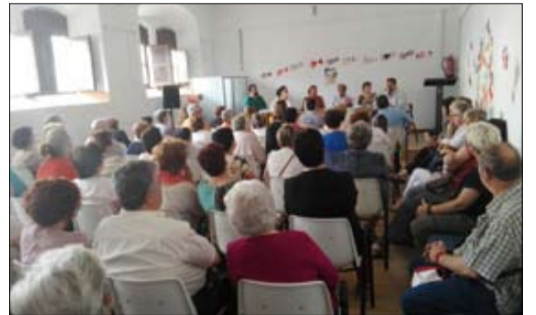
Arriba participantes de Puebla del Maestre. Abajo, de Zafra

"Un pueblo se juega su futuro en la capacidad que tenga para asumir el hambre y la sed de sus hermanos. En esta capacidad de socorrer al hambriento