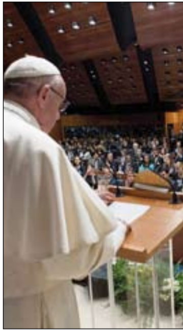
El Papa en la sede del PMA.

Por otro lado, el Santo Padre manifestó que "las burocracias mueven expedientes; la compasión, en cambio, se juega por