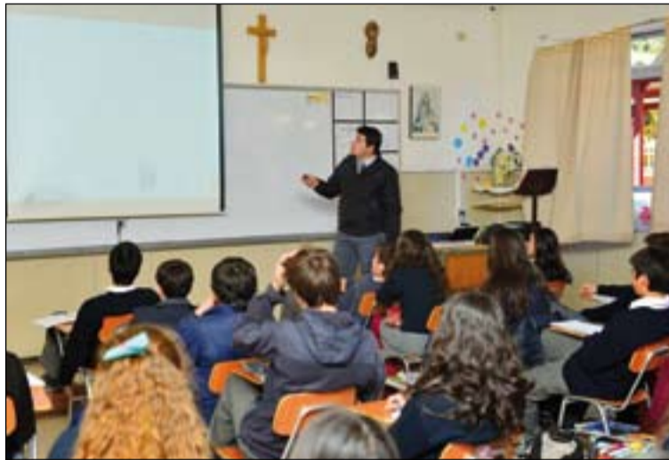
Muchos profesores de Religión cuentan con dos titulaciones.

Mérida-Badajoz, que coincide básicamente con la provincia de Badajoz hay 165 profesores de religión en Primaria y 70 en Secundaria. De ellos en Primaria tan solo 1 es sacerdote, un número que en secundaria se eleva a 3. Todos ellos prestan un gran servicio porque trabajan en centros pequeños donde es muy difícil mantener un profesor. En Extremadura el conjunto de profesores de Religión ronda los 500.