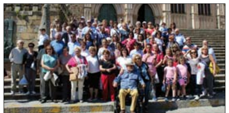
Arriba peregrinos de “Vida Ascendente”, abajo de “Espíritu Santo”.