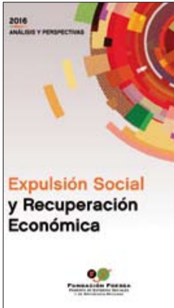
Portada del Informe de este año.

Para elaborar el Informe, los expertos del Comité Técnico de FOESSA han utilizado los indicadores que cualifican la cohesión social y que miden la fractura social de un país: la