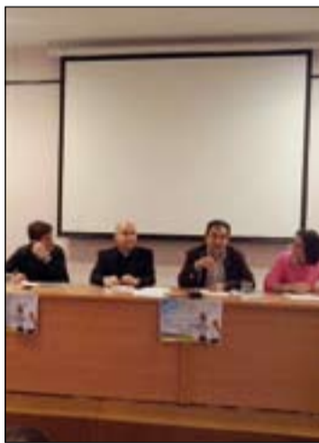
Participantes en la mesa redonda.

semanas y que será un modo de animar y prepararse para la JMJ. Junto con la canción también se presentará un video con un Flashmob, que se llevará a cabo en distintos momentos y lugares de la JMJ, en Cracovia.