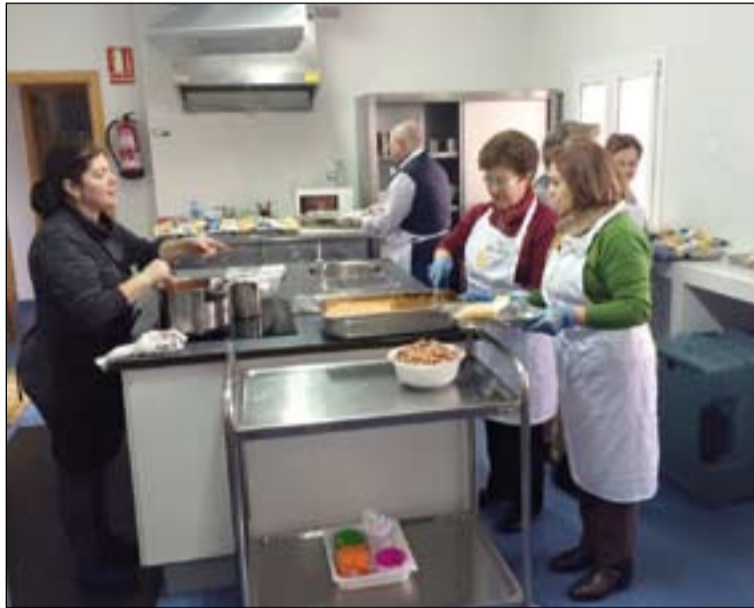
Cocina del comedor social, atendida por voluntarios.

El comedor no ofrece comidas a niños menores de 12 años, ya que cuentan con este