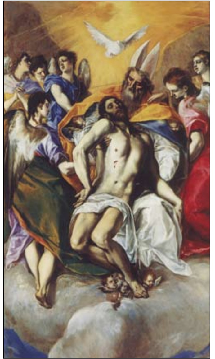
La Trinidad (1577-1579). El Greco. Museo del Prado (Madrid).

Todo lo que tiene el Padre es mío. Por eso os he dicho que tomará de lo mío y os lo anunciará.