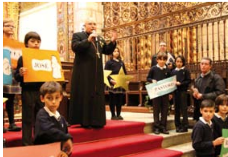
El Arzobispo dirigió unas palabras a los niños.

En una celebración entrañable con cantos de villancicos, representaciones navideñas y oración, don Santiago invitaba a todos a ser misioneros en sus ambientes y les aclaró lo importantes que son todos estos niños para el Arzobispo y para la Iglesia. Los distintos grupos le entregaron una felicitación navideña, que el Arzobispo se comprometió a enviar al archivo diocesano. Todos recibieron, junto a las estrellitas, el tradicional cuen-