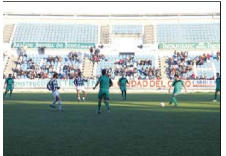
Arriba, jugadores de los equipos de los sacerdote y los toreros. En la foto inferior, partido entre toreros y exfutbolistas de 1ª División.