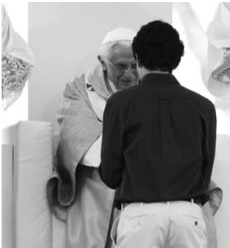
Benedicto XVI con un joven durante la JMJ Madrid 2011.

guardia sobre todo ante "la extendida tendencia a recurrir exclusivamente a los criterios de utilidad, del beneficio y del tener". Y señala que para educarse "en la compasión, la solidaridad, la colaboración, la fraternidad" es necesario "ser activos dentro de las comunidades y atentos a despertar las conciencias so-