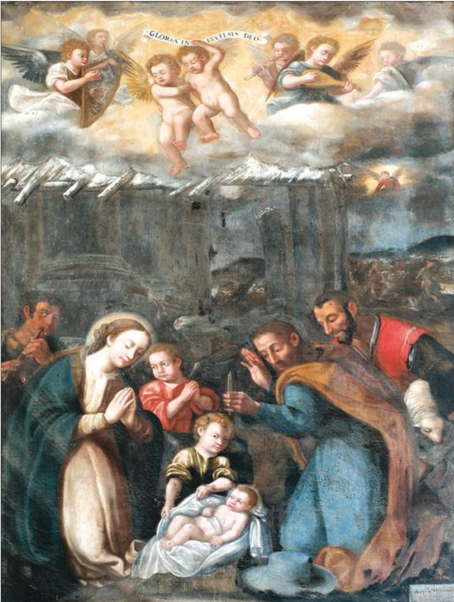
Cuadro del Nacimiento, de Antonio Monreal, 1633, que se encuentra en el Museo de la Catedral de Badajoz

AÑO XVIII • Nº 877 • SEMANARIO DE LA ARCHIDIÓCESIS DE MÉRIDA-BADAJOZ • 25 DE DICIEMBRE DE 2011