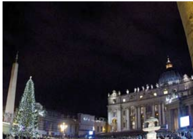
La plaza de San Pedro, en el Vaticano, con el abeto más alto del mundo.

Los antiguos germanos creían que el mundo y todos los astros estaban sostenidos pendiendo de las ramas de un árbol gigantesco llamado el "divino Idrasil" o el "dios Odín", al que le rendían culto cada año, en el solsticio de invierno, cuando suponían que se renovaba la vida. La celebración de ese día consistía en