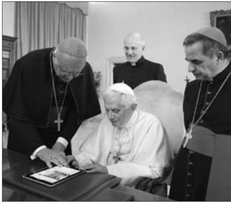
Benedicto XVI utilizando las nuevas tecnologías.

La primera pareja de pregunta-respuesta fue enviada poco tiempo después del envío del tuit de saludo: "¿Cómo podemos celebrar mejor el Año de la fe en nuestra vida diaria?" . Respuesta: "Dialoga con Jesús en la oración, escucha a Jesús que te habla en el Evangelio, en-