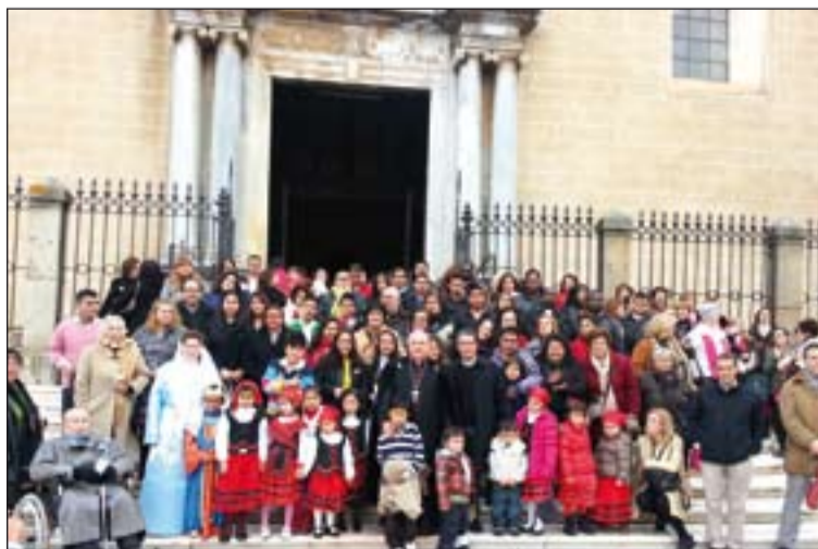
El Arzobispo con los asistentes a la fiesta del Divino Niño.

La fiesta del Divino Niño es una celebración muy popular en Sudamérica. Desde varios días antes estos cristianos inmigrantes, junto a españoles, se han reunido en distintas ca-