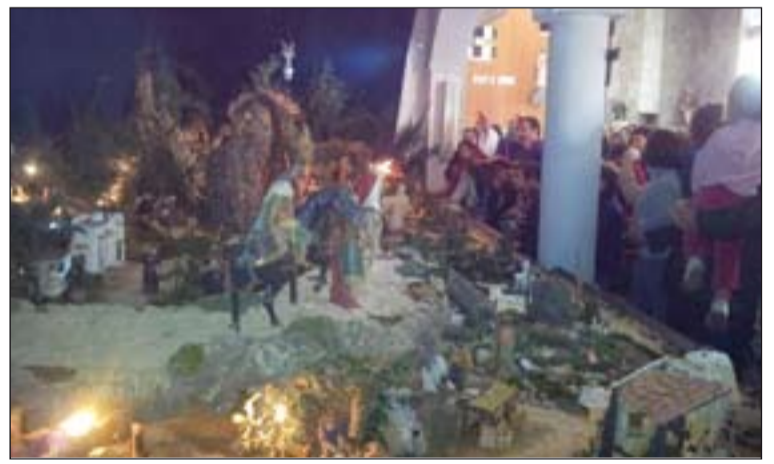
Arriba, Sembradores de Estrellas. Abajo, el P. Arenas bendice el belén hecho por profesoras y personal del Colegio de las Escolapias de Mérida.

Diocesana de Obras Misionales Pontificias, en nombre de los misioneros se les envía a todos a felicitar la Navidad.