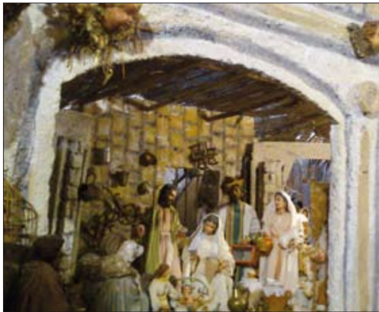
Belén que se encuentra en la parroquia de Fuente del Maestre, realizado por José M a Sanfélix.

"En la región en torno a Belén se usan desde siempre grutas como establo (...). Ya en Justino mártir y en Orígenes encontramos la tradición según la cual el lugar del nacimiento de Jesús había sido una gruta, que los cristianos situaban en Palestina. El hecho de que, tras la expulsión de los judíos de Tierra Santa en el siglo II, Roma transformara la gruta en un lugar de culto a Tammuz-Adonis, queriendo evidentemente borrar con ello la memoria cultural de los cristianos, confirma la antigüedad de dicho lugar de culto, y muestra también la importan-