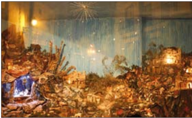
Arriba, belén de la parroquia de San Agustín de Badajoz. Abajo, el realizado por la parroquia de San Vicente de Alcántara.

miles de personas particulares, estará abierto hasta el día 6 y es visitable los días de diario de 17,00 a 21,00 horas, y los domingos y festivos a la misma hora por la tarde y, además, por las mañanas de 10,00 a 14,00 horas.