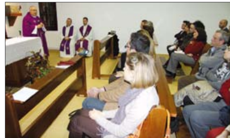
El Arzobispo presidió la Eucaristía.

cedido. En esta ocasión le han pedido al Divino Niño fuerzas y fe para afrontar aquello que les desconcierta y les duele.