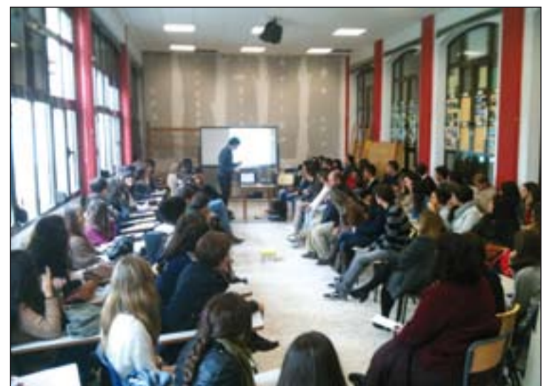
Participantes en el retiro.

Entre oraciones, reflexión y trabajo personal transcurrió la mañana, en un ambiente de profundización en el sentido de lo que esperamos desde la