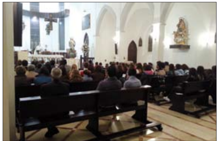
Arriba, jóvenes participantes en la Vigilia celebrada en Valverde de Leganés. Abajo, Vigilia que tuvo lugar en la capilla del Seminario.

acogía el día 4 una Vigilia de la Inmaculada a la que asistían un centenar de jóvenes entre seminaristas, alumnos del Colegio Diocesano y de otros colegios y parroquias de la ciudad.