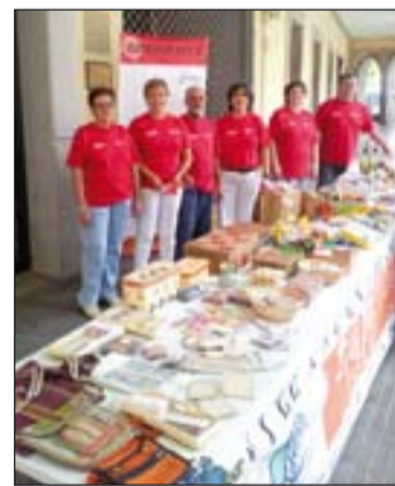
Voluntarios de Comercio Justo.

Los días 21 y 22 de diciembre se llevará a cabo la Operación Carretilla, a cargo de la Banda de Cornetas y Tambores "Ntro. Padre Jesús Nazareno". Lo obtenido irá a Cáritas parroquial de La Santa Cruz. El viernes 21 se realizará por la zona centro y el