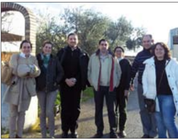
Miembros de la Delegación episcopal para la Catequesis.