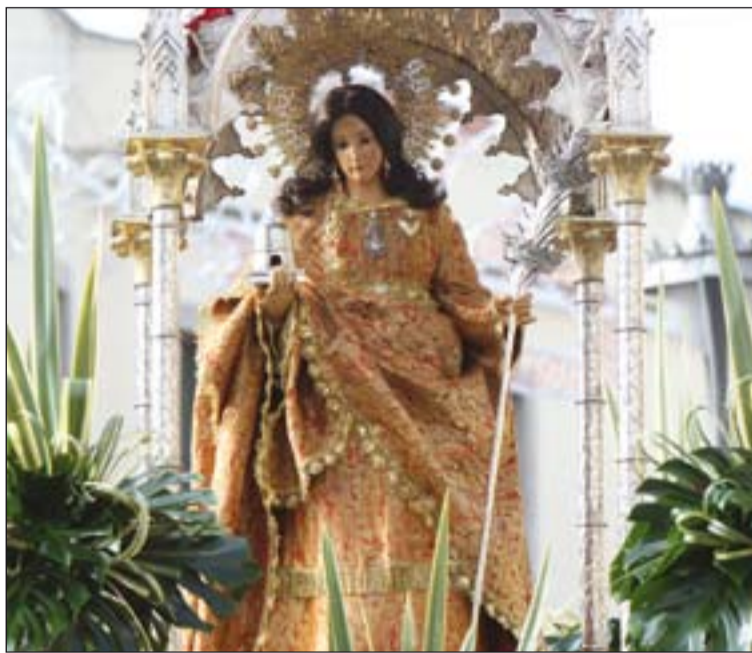
Imagen de santa Eulalia, por las calles de Mérida.