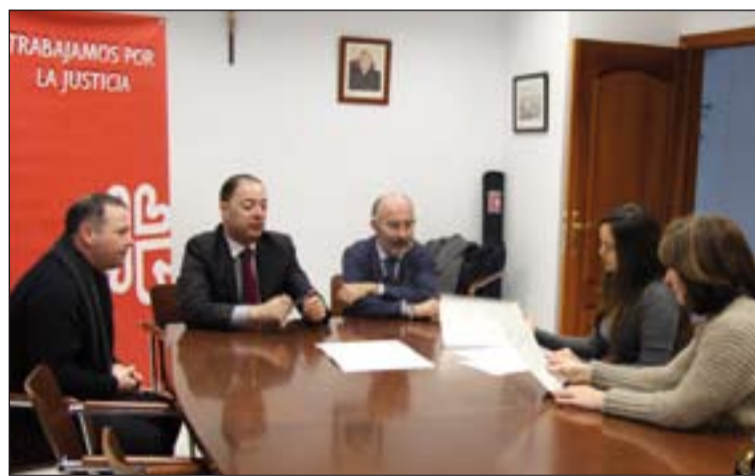
Representantes de Cáritas diocesana y de la Fundación "La Caixa".

ritense y de la Juventud de la diócesis, Bellido señala la declaración del templo de la santa como basílica. "El proceso va muy bien, manifiesta, lo que ocurre es que esto tiene sus pasos, pero tenemos una esperanza muy grande de que se consiga la declaración de Basílica menor. Se hizo un expediente muy serio que se envió a la Santa Sede y estamos esperando".