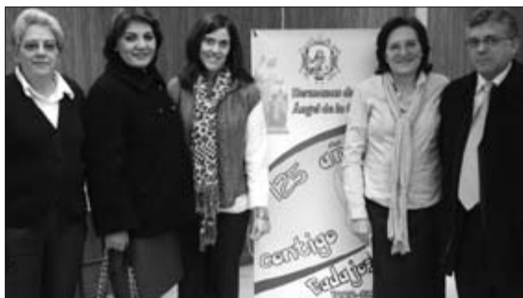
Arriba, alumnas del Colegio en 1950. Abajo, actual equipo directivo.

de pastoral diocesanos y plataforma Dando Color.