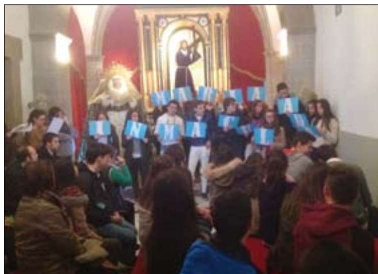
Arriba, celebración de la Eucaristía. Abajo, uno de los talleres entorno a la figura de María Inmaculada.