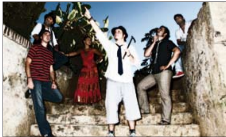
El Desván del Duende.

Besos de Cabra será presentado en sociedad a principios de año. El 17 de enero se pondrá a la venta en todo el país. Aunque serán sus paisanos extremeños los que podrán tenerlo el próximo 11 de diciembre gracias al Diario HOY , que distribuirá una edición especial de dos mil ejemplares junto con el periódico de ese día. Hablaremos entonces de todo el conjunto, hoy guardado con celo. De momento disfrutamos del sencillo Delinquentes y poetas , con la colaboración del grupo de Er Canijo de Jeré, Er Ratón y su banda y con la fórmula habitual del Desván: rumbita, diversión y buenagente .