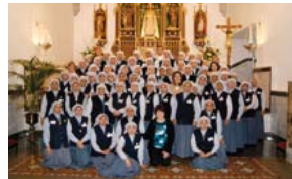
Grupo de religiosas participantes.