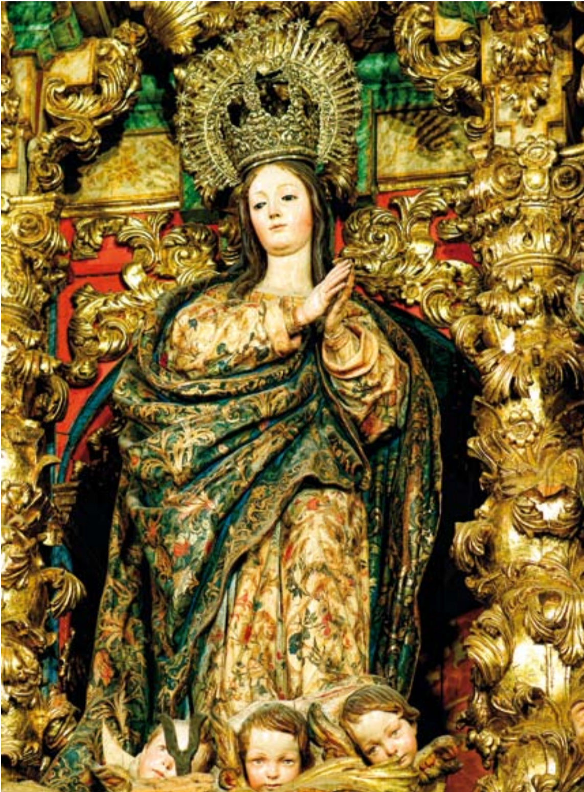
Inmaculada del retablo mayor de la Catedral de Badajoz.