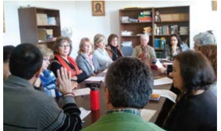
Voluntarias de los Proyectos de Mujeres.

En el acto se escenificaba el drama de las personas sin techo con la vestimenta negra y caretas blancas de la gente que asistía. También se leyó un manifiesto titulado "Todos somos ciudadanos. Nadie sin hogar".