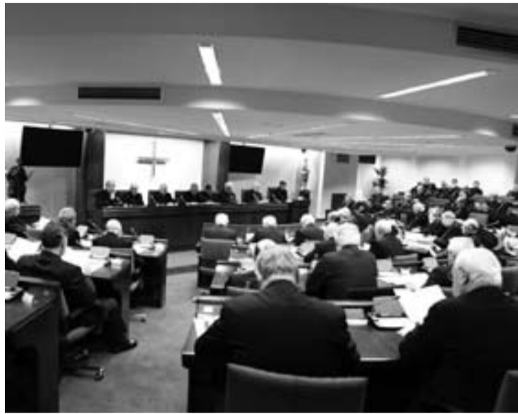
Sesión inaugural de la XCVIII Asamblea Plenaria.

El nuncio en España Renzo Fratini en su saludo recordó la Jornada Mundial de la Juventud de Madrid afirmando: "Fue