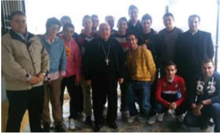
El Arzobispo junto a los jóvenes que participaron en este Proyecto.

Comienza el Proyecto Samuel; Del 18 al 20 de noviembre arrancaba un nuevo proyecto dentro del Plan Diocesano de Animación Vocacional (PDAV). Se trata del Proyecto Samuel, en el que han participado 11 chicos de 6 localidades con la intención de profundizar sobre su vocación.