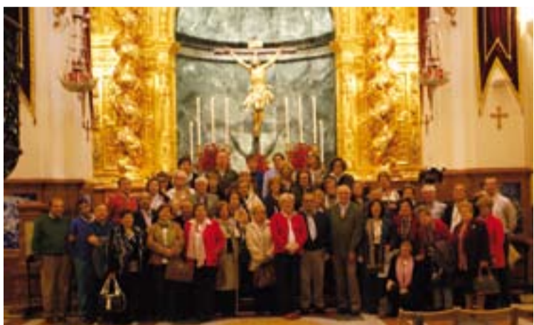
Cofrades que han viajado a Sevilla.

Durante cinco días profesores universitarios y expertos de distintos ámbitos y de diversos puntos de España han abundado en el tema central del ciclo.