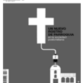
Portada del monográfico