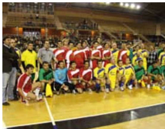
Participantes en el partido celebrado el año pasado.

Los sacerdotes y los ex futbolistas jugarán en el mismo equipo, mientras que los toreros irán solos. En el equipo de