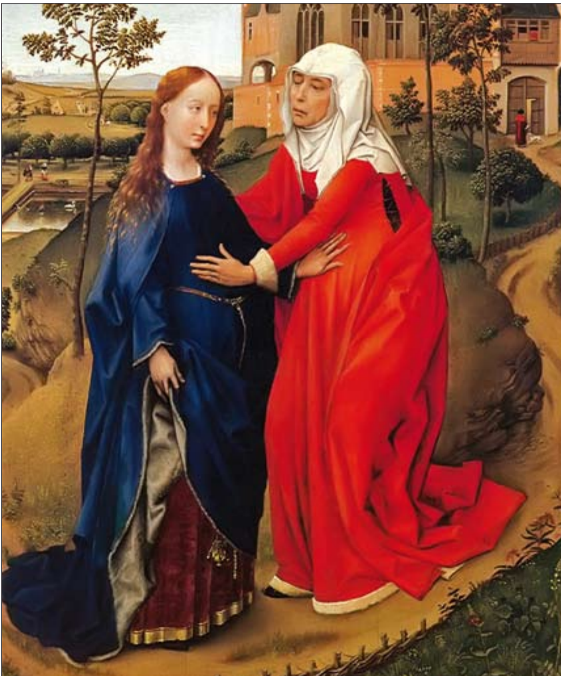
La Visitación a santa Isabel, de Rogier van der Weyden (1435).