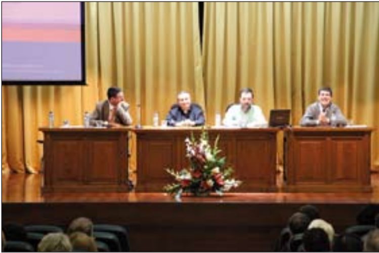
Primera ponencia de esta edición del Aula Fe-Cultura.

Aula Fe-Cultura.- El salón de actos del Seminario ha acogido esta semana el VIII Ciclo de Conferencias del Aula Fe-Cultura. En él han participado profesores de distintas universidades españolas y especialistas en diversas áreas del saber: economía, ciencias sociales y jurídicas, ingenierías, sanidad y educación y doctrina social de la Iglesia.