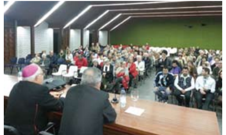
Encuentro del Arzobispo con sus colaboradores, en la parroquia San José, en Badajoz.