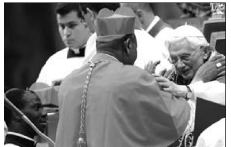
Benedicto XVI felicita al nuevo cardenal, John Olorunfemi Onaiyekan.

"Están presentes ante su santidad pastores de Iglesias antiguas, testigos fuertes y valientes de la fe en Jesucristo, nuestro Señor; profesan además sincera devoción al sucesor