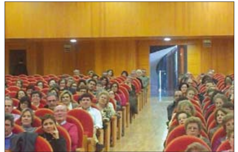
Arriba, reunión celebrada en Badajoz. Abajo, encuentro llevado a cabo en Almendralejo.

y oración por las necesidades de toda la Iglesia.