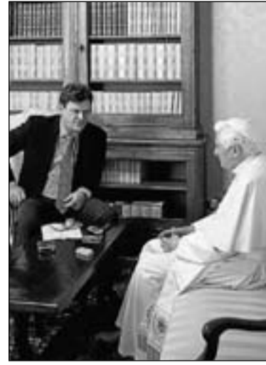
Benedicto XVI no ha dejado ninguna pregunta sin contestar en el libro de Peter Seewald, editado en España por Herder.

El volumen que se presenta hoy, dijo, “es una entrevista que, en cierto sentido supone un reto para hacer un serio examen de conciencia dentro y fuera de la Iglesia con el fin de lograr una verdadera conversión del corazón y de la mente. Las condiciones de vida de la sociedad, la ecología, la sexualidad, la economía y las finanzas, la misma Iglesia... son cuestiones que requieren un esfuerzo especial para verificar la dirección cultural del mundo de hoy y las perspectivas que se abren para el futuro. Benedicto XVI no se deja intimidar por las ci-