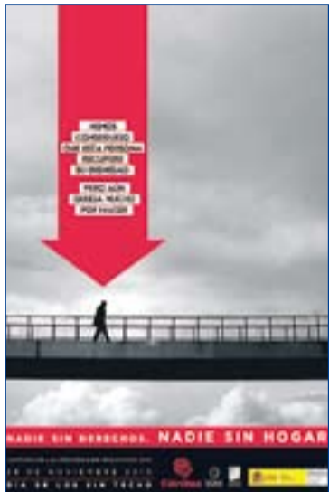
Cartel de la campaña 2010.

En cuanto a nuestra Diócesis, Cáritas cuenta con dos centros: el Centro Padre Cris-