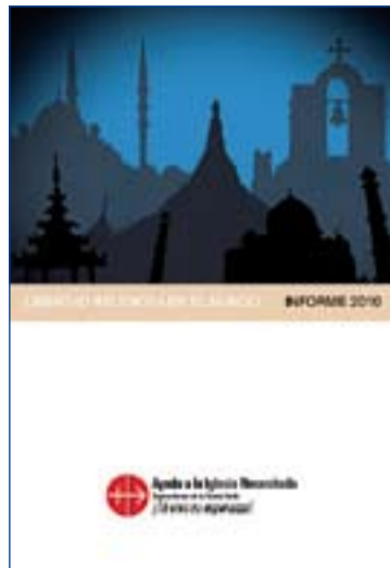
Portada del Informe.

Desde el anterior informe, la situación no ha mejorado, según esta organización que presta ayuda a cristianos de todo el mundo. Según informa AIN la tendencia creciente a la persecución y discri-