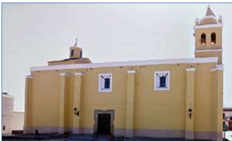
Iglesia parroquial de Villagonzalo.

Su iglesia parroquial es la de Nuestra Señora de la Concepción o Purísima Concepción, edificio del siglo XVI que fue modificado posteriormente en el siglo XVIII y prácticamente reconstruida en 1936 tras la Guerra Civil, siendo sometida a reformas mucho más actuales. Hoy es uno de sus edificios más simbólicos. Podemos verla pulcramente enalada en un bello tono ocre, tanto en su interior como en su exterior. Resalta al frente su torre-fachada con remate en chapitel y cubriendo