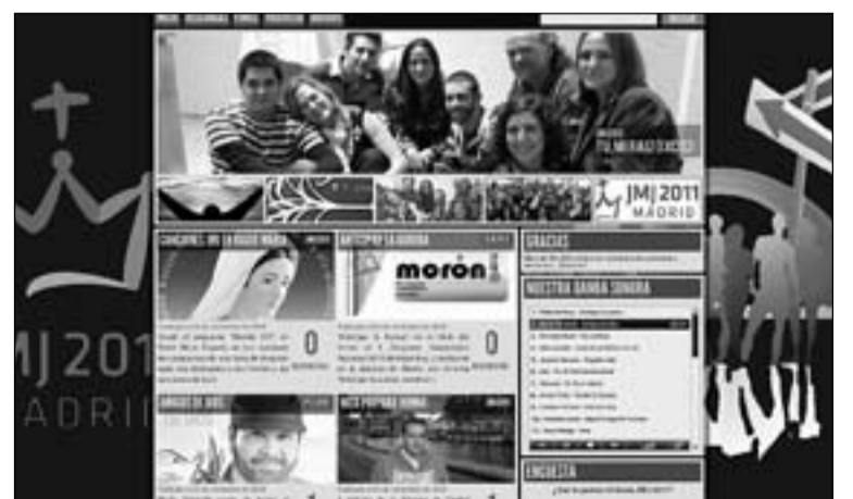
Página principal de Trovador.com.

El himno en un acto juvenil de este estilo suele calar entre los participantes y con más fuerza tratándose, como en este caso, de una Jornada Mundial de la Juventud. Reciente tenemos el caso del Receive the