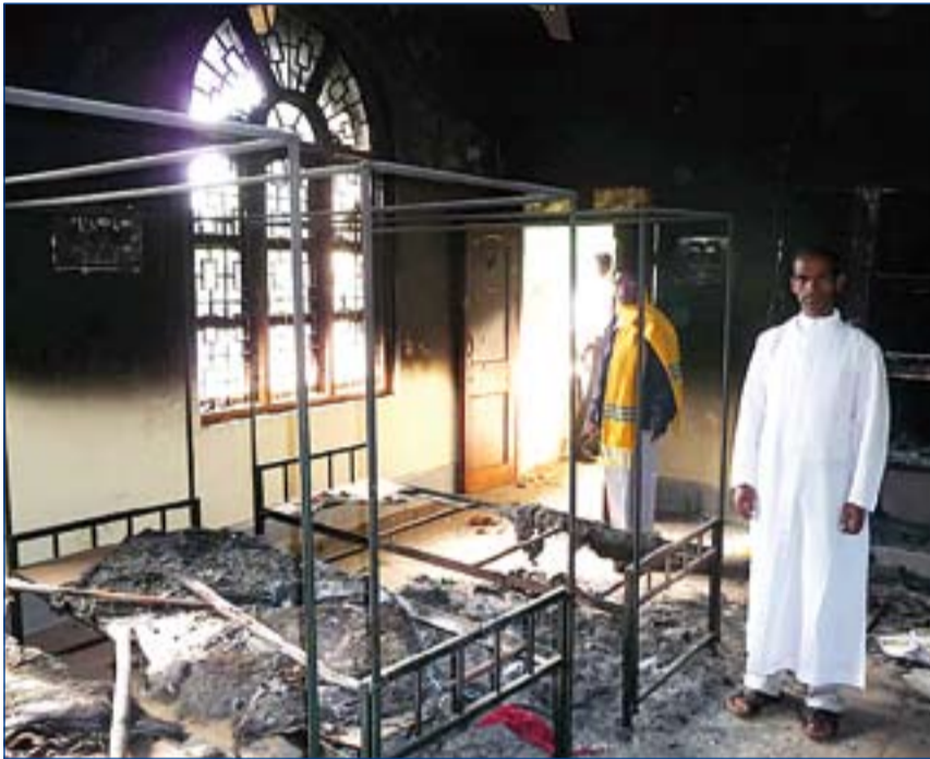
Centro Pastoral de Konjamendi, en Orissa (India), que sufrió el ataque de extremistas hindúes.

Presentado el nuevo Informe sobre Libertad Religiosa de la asociación católica "Ayuda a la Iglesia Necesitada"