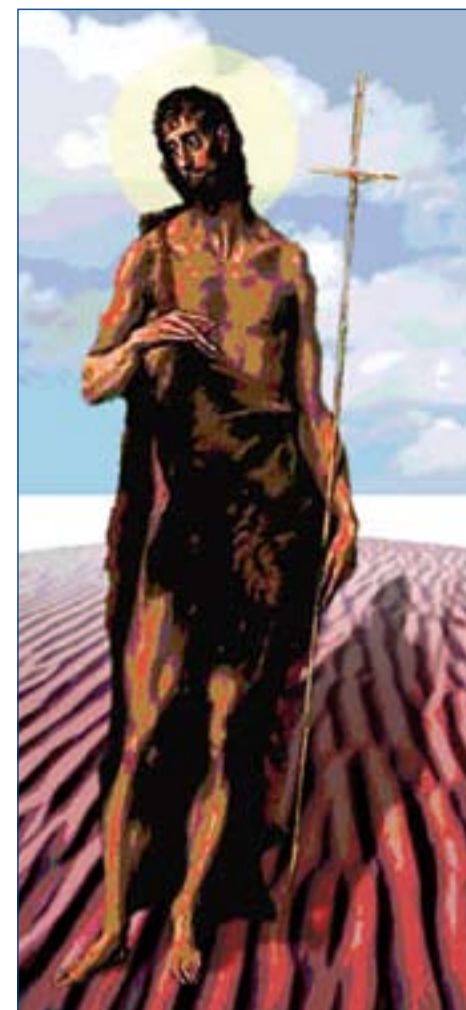
San Juan Bautista, es una de las figuras del tiempo litúrgico de Adviento.

"Una voz clama en el desierto: Preparad el camino del Señor, haced rectas sus sendas". Este versículo del Canto de la consolación del Deuterocanónico que tiene especial relieve en el Adviento, suele entenderse como un reconocimiento de la inutilidad de un mensaje que se oye pero sin hacer caso alguno. Sin embargo el verdadero sentido es recordar al pueblo de Israel el tiempo en que estuvo vagando por el desierto, cuando Dios les ayudó a pesar de su incredulidad. Aquel tiempo se volverá a repetir, pero entonces no será Moisés quien conduzca al pueblo por el desierto, sino "que viene el Señor Yahwéh con poder... Como un pastor pastorea a su rebaño..." (Is 40, 11). Cada Adviento recordamos el