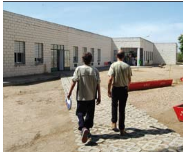
El Centro Hermano, en Badajoz.

Para llevar a cabo esta labor, los voluntarios son fundamentales. Unas 40 personas dedican parte de su tiempo al trabajo con las personas sin hogar.