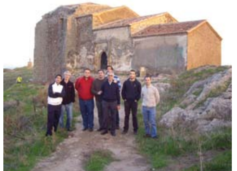
Seminaristas mayores, acompañados por varios sacerdotes

ron a la localidad de Villanueva de la Serena donde celebraron la Eucaristía y las vísperas con las hermanas Concepcionistas Franciscanas, que les mostraron su cariño, su oración por las vocaciones al ministerio sacerdotal, dedi-