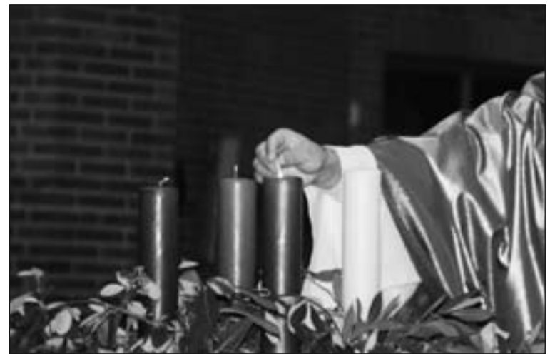
Arriba, la Corona de Adviento, elemento característico de este tiempo litúrgico. Abajo, derecha, san Juan Bautista, figura relevante en el Adviento, imagen perteneciente al retablo de la Catedral de Badajoz.

Uno de los elementos característicos de este tiempo litúrgico es la Corona de Adviento. Su origen se encuentra en la tradición pagana europea que consistía en encender velas durante el invierno para representar al fuego del dios Sol, para que regresara con su luz y calor durante el invierno. Los primeros misioneros aprovecharon esta tradición para evangelizar a las personas. La corona está formada por gran variedad de símbolos: la forma circular, es se-