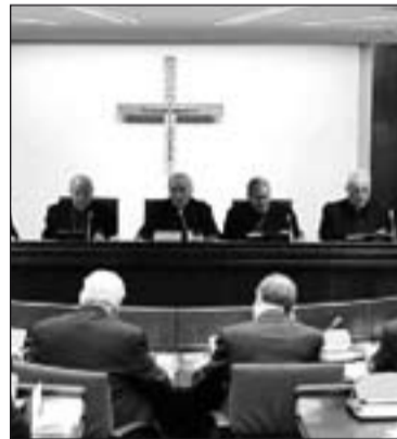
Rouco Varela durante la Plenaria.

Además, el cardenal dedicó la mayor parte de su discurso de apertura a un recuerdo y comentario, de la Jornada Mundial de la Juventud (JMJ) a la que definió como "una verdadera cascada de luz". Y aseguró que "¡hay una juventud de hoy, alegre, educada, sacrificada, expansiva y comunicativa que es Iglesia al cien por cien! ¡Es posible transmitir la fe a las nuevas