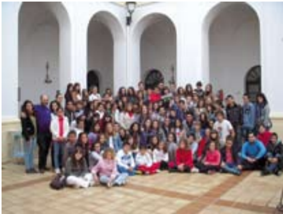
Grupo de jóvenes que participaron en la convivencia Damasco.

Convivencia Damasco; La localidad de Jerez de los Caballeros ha acogido la segunda convivencia de jóvenes del proyecto Damasco del presente curso.