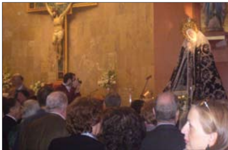
La Soledad en la parroquia San Juan de Ribera

La presencia de la Virgen de la Soledad en esta parroquia también está íntimamente unida a la próxima