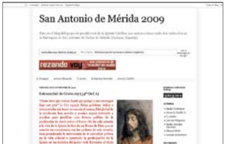
Portada de la web sanantoniomerida2009.blogspot.com

Esta semana propongo más de una web. En concreto tres que tienen que ver con el Adviento. Comencemos por el conocimiento: nada mejor que la Wikipedia con un excelente artículo: http://es.wikipedia.org/wiki/Adviento . Creo que el artículo de la Wiki está reafirmado por esta web: www.primeroscristianos.com . En el apartado del menú "los orígenes de ..." está un magnífico artículo sobre los orígenes del Adviento que os recomiendo. Ya traeremos otra semana esta web, en la