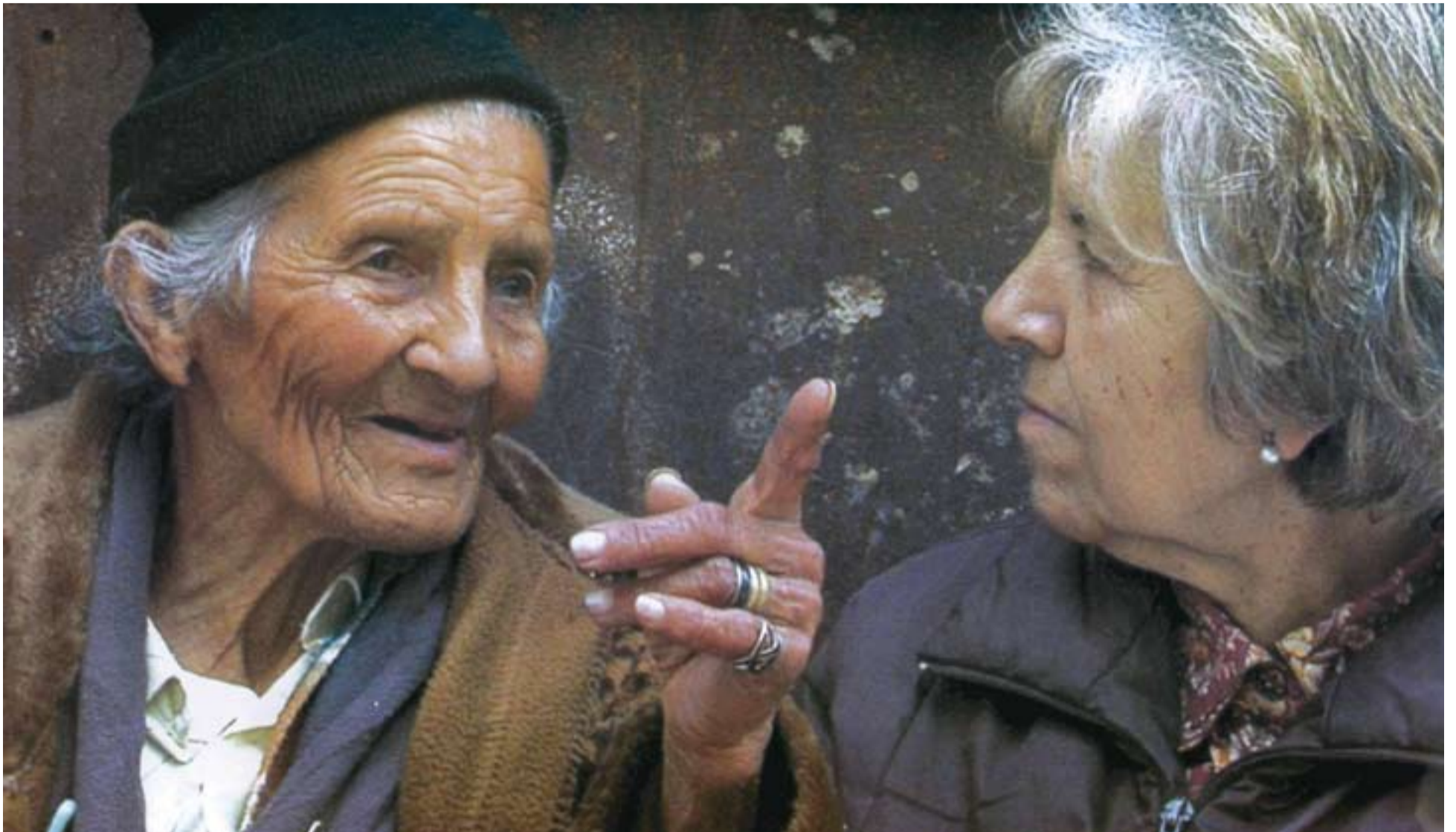
Fotograma del documental "Nosotros" de Carlos Esbert.