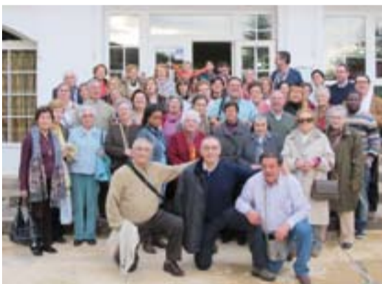
Fieles de la parroquia de Santos Servando y Germán que participaron en la peregrinación.

En un ambiente distendido y alegre, combinando momentos de juego, reflexión y oración, 77 jóvenes de 20 localidades diferentes de la provincia han profundizado en la figura de María. Estuvieron acompañados por 20 animadores y un equipo de voluntarios de Jerez, que con ilusión se dedicaron a transmitir su Fe y crear un ambiente agradable de convivencia. Como colofón los jóvenes compartieron la Eucaristía con la comunidad parroquial.