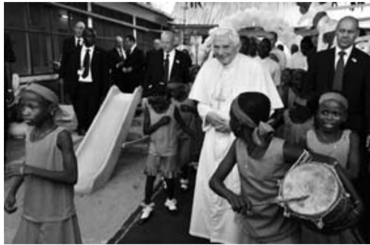
Benedicto XVI durante su viaje a Benín.