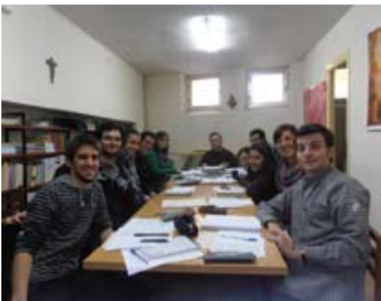
Equipo de responsables de JEC.

El objetivo de la peregrinación, que tiene antecedentes en otras a lugares franciscanos como El Palancar, La Rábida o la Virgen de la Regla en Chipiona es crear comunidad y conocer lugares franciscanos.