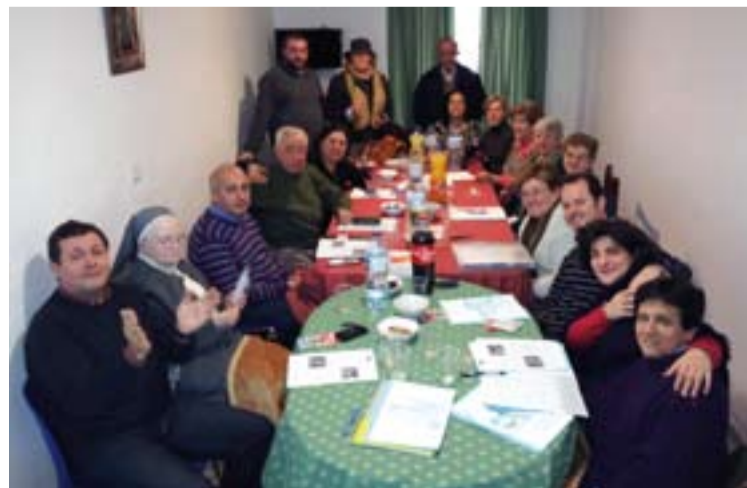
Grupo de Formación de Animadores Misioneros.

Con la comida de fraternidad en Alconchel terminó esta jornada del Grupo de Animadores Misioneros.