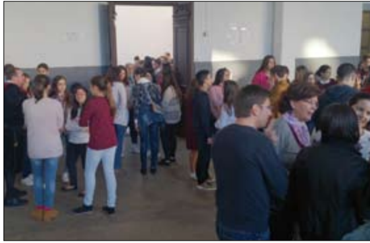
Dinámica en la que participaron los jóvenes durante el Encuentro.

En este encuentro se aprovechó para motivar a los jóvenes en la preparación de la Vigilia diocesana de la Inmaculada, el próximo 7 de diciembre, que este año se celebrará en