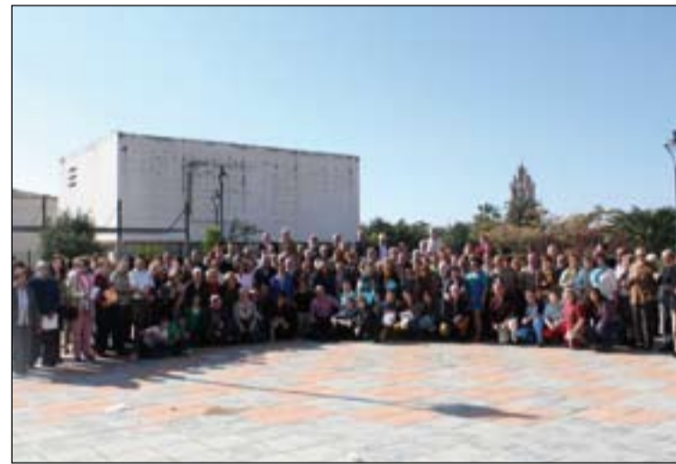
Participantes en el Encuentro formativo de Cáritas diocesana.

Este encuentro se enmarca dentro del Plan Anual de Formación de Cáritas Diocesana de Formación, que este año plantea el trabajo en profundidad de la Instrucción Pastoral La Iglesia, servidora de los pobres . Para ello se han elaborado unos cuadernillos de formación que irán trabajando las Cáritas parroquiales a través de sus encuentros arciprestales.