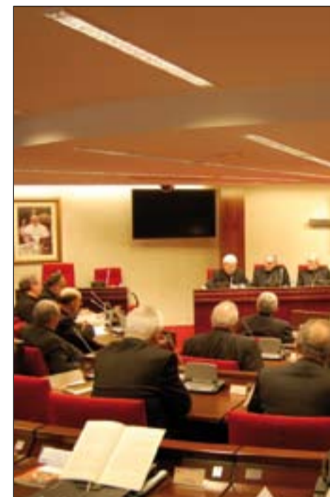
Asamblea plenaria de los obispos españoles durante el discurso del Nuncio.