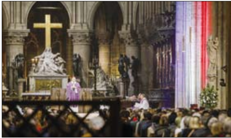
Funeral a las víctimas del atentado en la catedral de Notre Dame, en París.

Al día siguiente, a primera hora de la mañana, el Papa Francisco enviaba un telegrama de condolencias a través del Secretario de Estado del Vaticano, Cardenal Pietro Parolin, al Arzobispo de París, el Cardenal André Vingt-Trois, en el que, de nuevo, condenaba enérgicamente la violencia y le pide "a Dios que inspire a todos pensamientos de paz y de solidaridad, y extienda sobre las familias que están en la