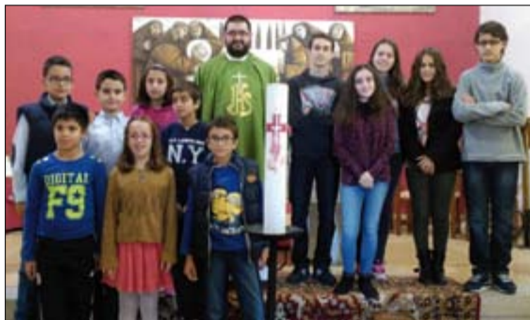
Niños y jóvenes de la parroquia de San Francisco de Olivenza.

Esta entrega, ante la asamblea dominical, fue un gesto de adhesión de los niños y jóvenes a la Iglesia diocesana y de acción de gracias a Dios por el regalo de la fe y de los materiales que los obispos han dispuesto para su formación.