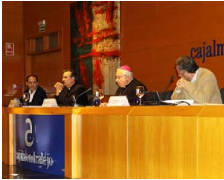
El encuentro fue presidido por Monseñor García Aracil.

cesidades de nuestra comunidad parroquial". Algunos sacerdotes pidieron también mayor implicación de los laicos en la tarea de financiar a sus comunidades, "que no sea sólo el cura el que pida" y que se haga un estudio a nivel diocesano sobre las ermitas, templos, casas rectorales etc. para ver las necesidades y dar prioridades en las actuaciones sobre el patrimonio.