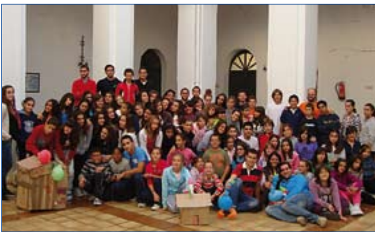
Convivencia celebrada en Jerez.

■ El tema será tratado desde la Fenomenología, la Teología, la Psicología y la Filosofía. Además, como novedad, habrá una mesa redonda. Última