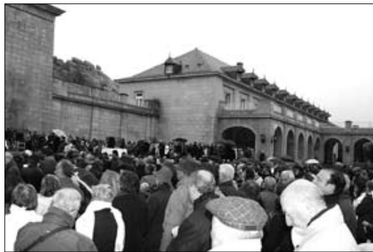
Cientos de personas asistieron a la Eucaristía.