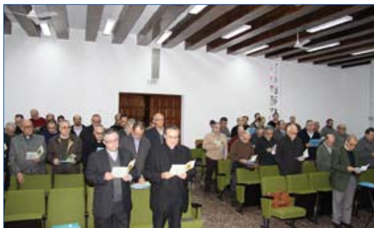
Más de 70 sacerdotes han participado en las jornadas.