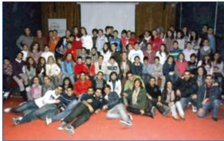
Los chavales que han participado en el encuentro de Badajoz.

En esta primera etapa del Proyecto, los niños han trabajado en torno a la película Up , a través de juegos, celebraciones, reuniones y veladas, con la que aprendieron a mirar más allá