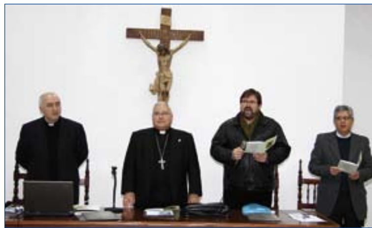
Monseñor García Aracil presidió la apertura de las jornadas.