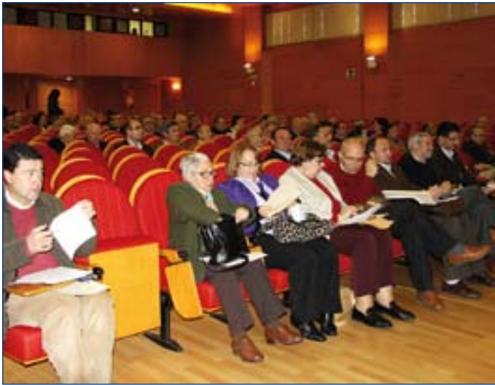
El salón de actos de Cajalmendralejo acogió la asamblea final del encuentro.

■ Se ha celebrado en Almendralejo un encuentro de estos Consejos, donde se estudió cómo mejorar la situación económica de las parroquias.