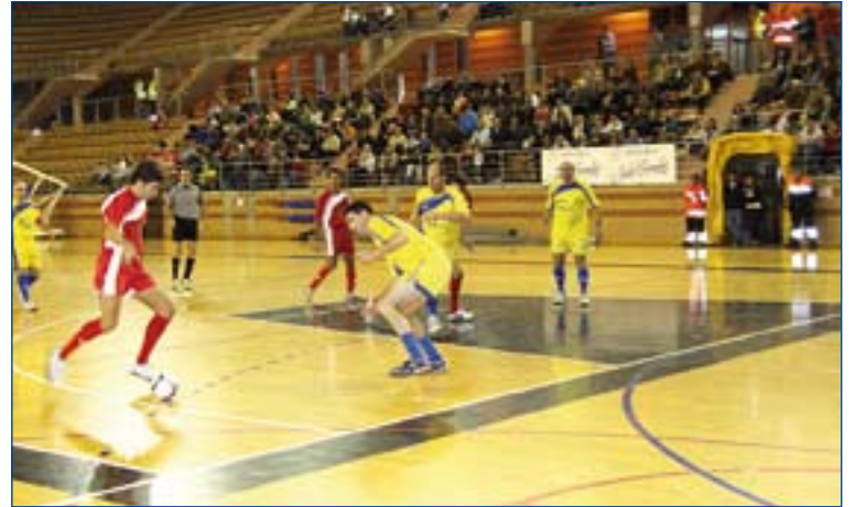
El público, como en anteriores ocasiones, no faltó al encuentro.