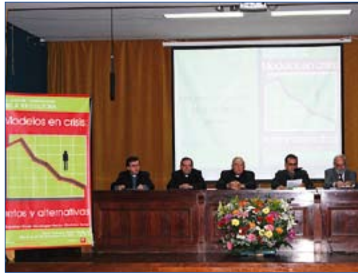
Clausura del Aula Fe-Cultura 2009.

■ Por sexto año se celebra en Badajoz el Ciclo de conferencias del Aula Fe-Cultura. En esta ocasión, el tema es el sentido de la vida.