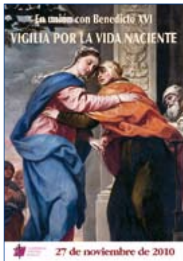
Cartel de invitación a la Vigilia.

Esta iniciativa, explicó el Pontífice tras el rezo del Ángelus el pasado domingo, "está en común con las Iglesias particulares de todo el mundo", y se ha recomendado su desa-