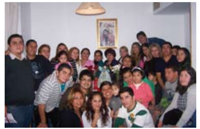
Comunidad latinoamericana que participa en la Novena.