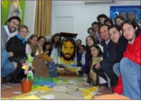
Participantes en "Vive con CENTRO"

Vive conCENTRO; La capilla del colegio de Santo Ángel de Badajoz acogió el pasado día 8 la II edición de la iniciativa de oración Vive conCENTRO . Ha sido un momento profundo, donde han reflexionado voluntarios de Dando C@lor (oncología pediátrica), personas del Movimiento San José del colegio Sagrada Familia, colegio y comunidad de HH. del Santo Ángel, Maristas, colegio diocesano, proyecto "Pozo de Jacob" del PDAV, Salesianos, OSCUS y parroquia San Juan de Ribera, acerca de dónde estamos en este camino de seguimiento a Jesús. La próxima oración es el martes 22 de noviembre, a partir de las 19'30 h.