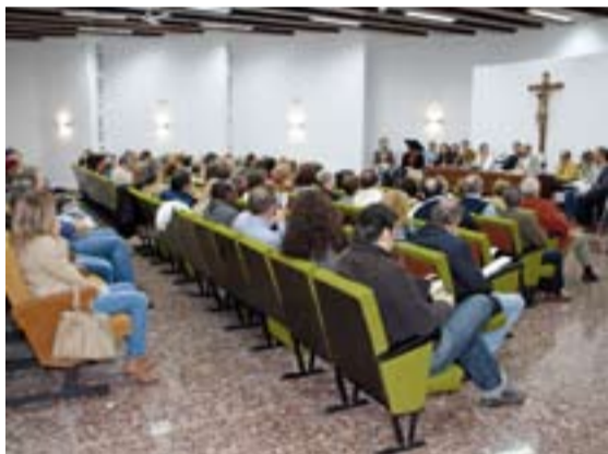
Clausura del Cursillo de Cristiandad nº 243

Vive conCENTRO; La capilla del colegio de Santo Ángel de Badajoz acogió el pasado día 8 la II edición de la iniciativa de oración Vive conCENTRO . Ha sido un momento profundo, donde han reflexionado voluntarios de Dando C@lor (oncología pediátrica), personas del Movimiento San José del colegio Sagrada Familia, colegio y comunidad de HH. del Santo Ángel, Maristas, colegio diocesano, proyecto "Pozo de Jacob" del PDAV, Salesianos, OSCUS y parroquia San Juan de Ribera, acerca de dónde estamos en este camino de seguimiento a Jesús. La próxima oración es el martes 22 de noviembre, a partir de las 19'30 h.