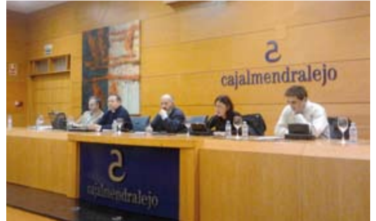
Encuentro de las Cáritas parroquiales, en Almendralejo.

Se pretende que la iniciativa parta de los Consejos Parroquiales de Asuntos Económicos pero con implicación de los Consejos Pastorales y del resto