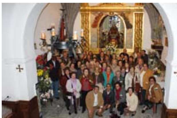
Peregrinos en el Santuario de Piedraescrita, Campanario.

La peregrinación ha tenido lugar 11 días después del viaje realizado a las Edades del Hombre.