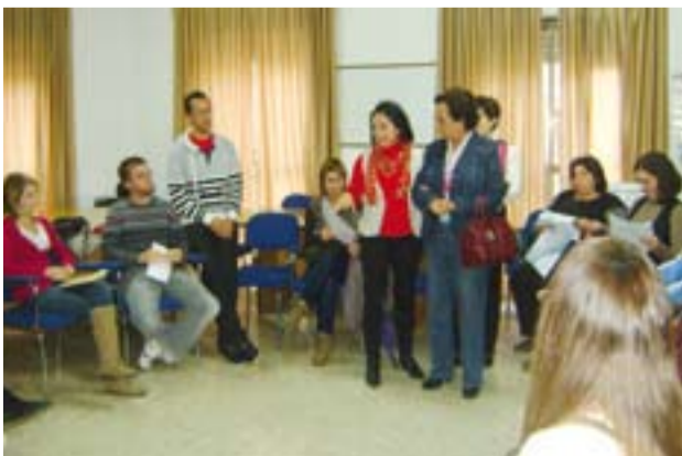
Inauguración del curso.

Junta de Extremadura y su objetivo es formar a personas que realicen actividades de animación con niños o jóvenes, capacitándolos de los conocimientos y herramientas necesarias para desarrollar una labor educativa y dinamizadora en el tiempo libre.