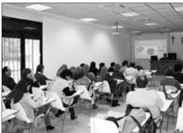
Participantes en este Curso.

Los temas tratados se centraron en los siguientes