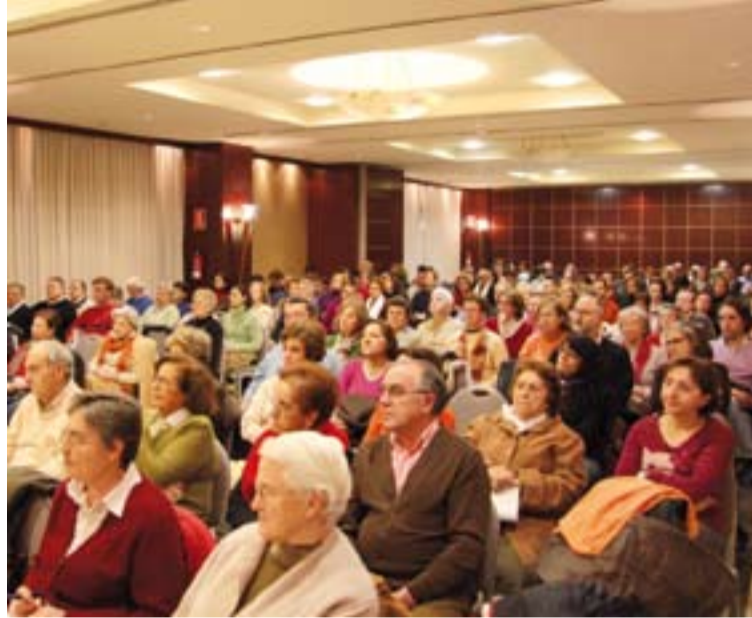
Asistentes a una de las ponencias presentadas el año pasado.

Según Andrades Ledo el ámbito de relación de la fe y la cultura es la preocupación por el ser humano, todo lo que el ser humano comporta, desde su dimensión relacional hasta la búsqueda de felicidad, hasta la clave del sentido, la dimensión de esperanza, la apertura a la trascendencia, todo lo que al hombre le puede preocupar". Todo ello es tema de interés "tanto para el literato, como para el que se preocupa de la antropología cultural o para el hombre religioso, sea de una religión o sea de otra".