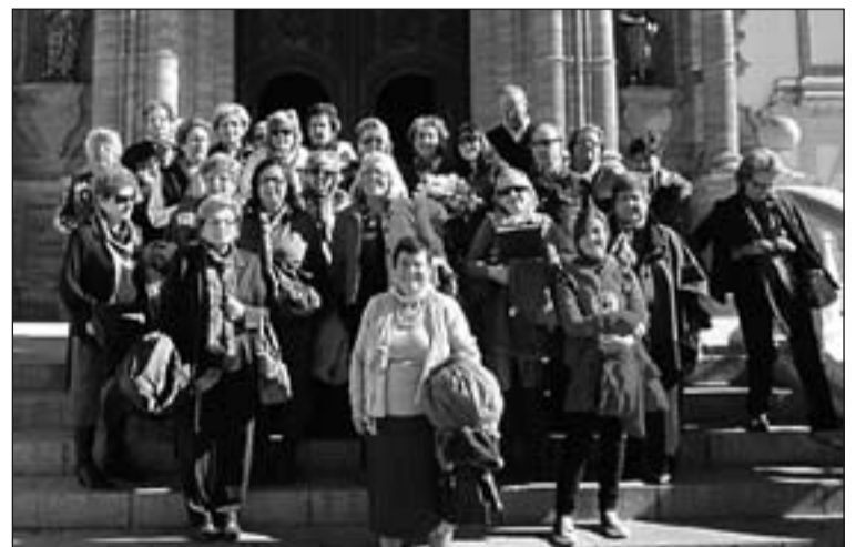
Peregrinos que participaron en el viaje.

Tras la comida los peregrinos regresaron a la ciudad pacense, desde donde ya preparan un viaje a Zaragoza para asistir al VIII Congreso Nacional de M ra Auxiliadora, que se celebrará