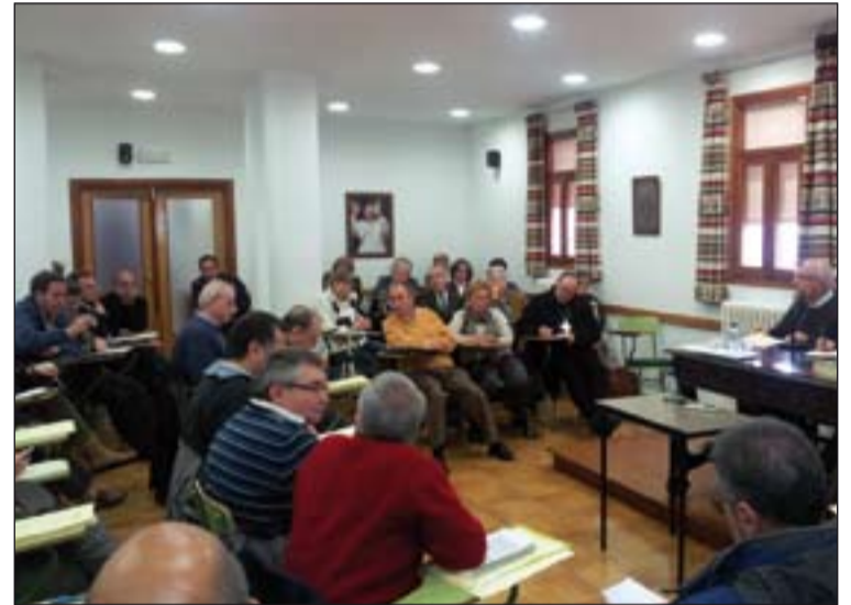
Participantes en este encuentro.

III Encuentro de Apostolado Secular de la Provincia Eclesiástica