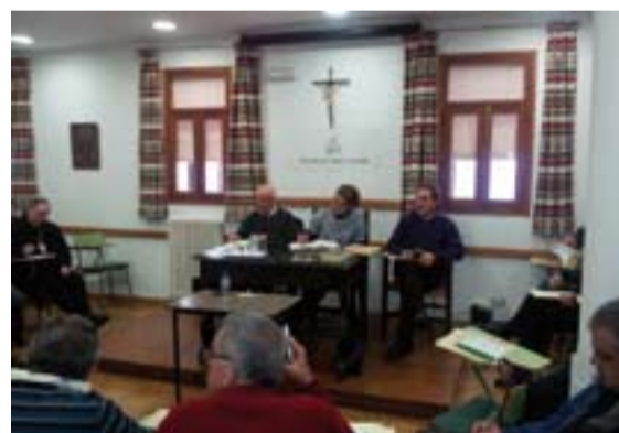
Momento del Encuentro de Apostolado Seglar.