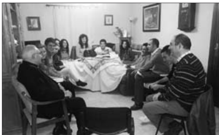
Momento de la reunión.

El Arzobispo los animó a buscar la verdad desde su ser universitarios y debatió con ellos las inquietudes y dificultades que tienen estos jóvenes para vivir su fe desde los distintos ámbitos en los que se mueven.