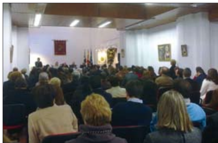
Asistentes al encuentro.

El IV Encuentro de Jóvenes cofrades ha sido organizado en esta ocasión por la Hermandad del Stmo. Cristo de la Misericordia y Ntra. Sra. de las Angustias de Fuente de Cantos, y algunos de los actos además de la eucaristía, fueron una charla coloquio en la Casa de la cultura de la localidad, a la que llegaron acompañados por la Banda de música