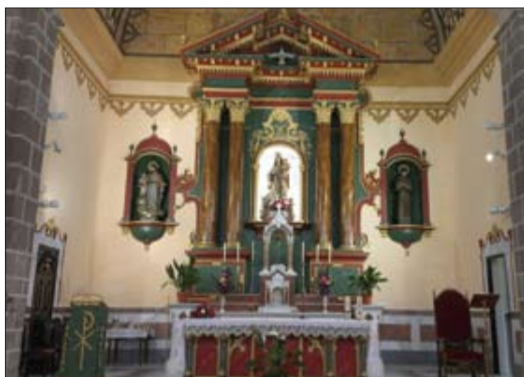
Iglesia del Carmen, tras la restauración.

En otro orden de cosas, la Delegación Episcopal para las Migraciones, con la colaboración de la Delegación para la Cooperación Misionera, han convocado y celebrado en Mérida, en la Parroquia de Cristo Rey, la Eucaristía y posterior convivencia con un nutrido grupo de inmigrantes de varios países, sobre todo de Hispanoamérica y África.