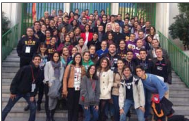
Jóvenes universitarios participantes en el encuentro

vios, el 7 y 8, se desarrolló en Madrid, en la sede de la Conferencia Episcopal Española, el XXVIII Encuentro de Delegados Diocesanos de Pastoral Universitaria, bajo el lema "La Universidad actual