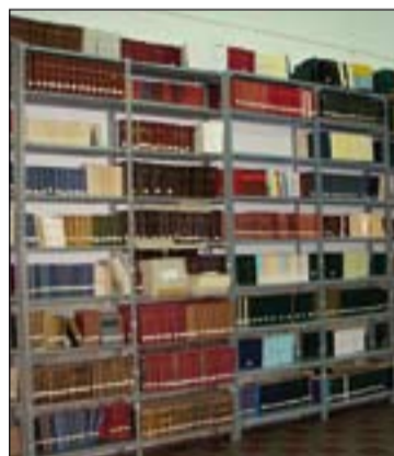
Fondos de la Biblioteca.

La realidad actual es que en la Biblioteca del Seminario Metropolitano de San Atón de Badajoz se custodia la mejor colección de Ciencias Teológicas, Bíblicas y Jurídico-Eclesiásticas de Extremadura con un total de 43.000 volúmenes. Venimos haciendo un loable esfuerzo por ir dando a conocer al público nuestros fondos por medio de publicaciones, exposiciones y visitas guiadas.