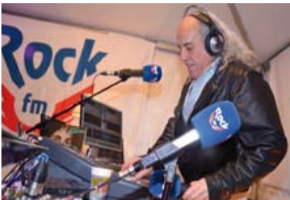
El Pirata, durante una retransmisión de Rock FM.