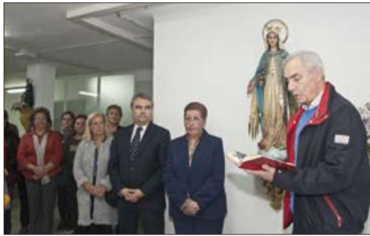
Bendición de las nuevas instalaciones del Comedor.