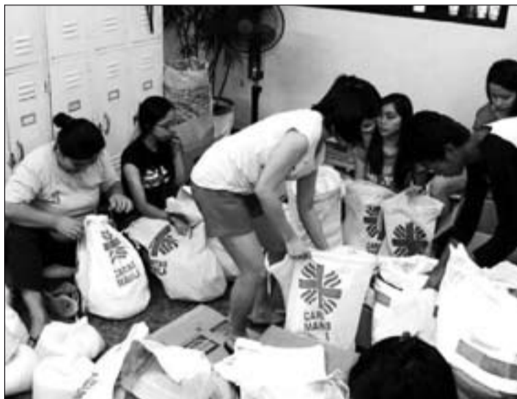
Arriba, damnificados refugiados en una iglesia. Abajo, Cáritas Manila entregando bolsas con víveres.

Ajuy, Estancia y Balasan, han sido destruidas y los voluntarios católicos siguen trabajando para salvar vidas. Entre las diócesis más afectadas, está la Archidiócesis de Palo, que incluye la ciudad de Tacloban. Allí más de 150.000 residentes se han visto afectados por el tifón, se han quedado sin hogar. Se está tratando de organizar un “centro de crisis” para hacer frente a la emergencia y distribuir las ayudas. Las 15 parroquias de Tacloban son los puntos de distribución y el Santuario del Santo Niño en Tacloban ha sido elegido como punto de referencia y recogida de las mercancías de los donantes.