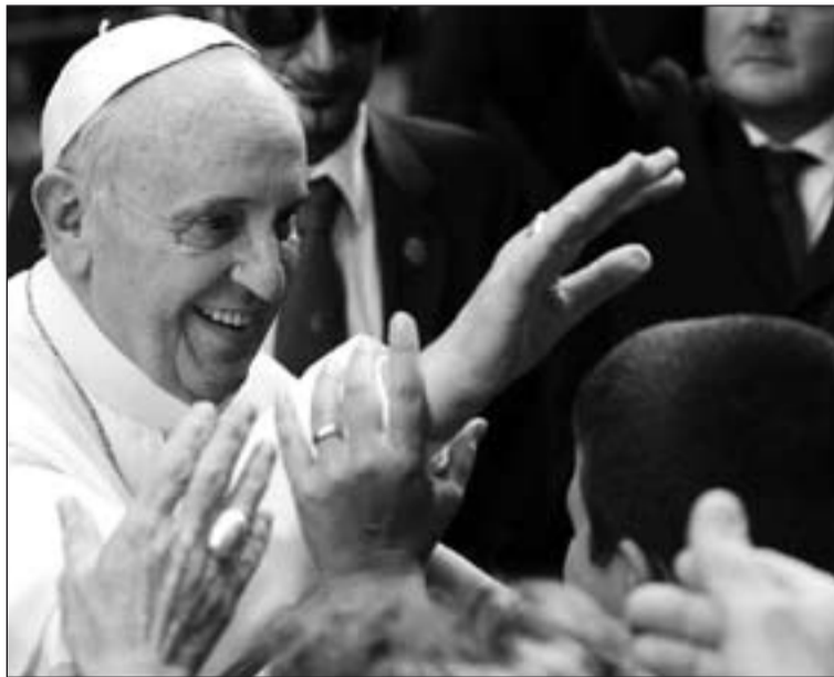
El Papa Francisco saluda a los fieles.

Cameron (11), Carlos Slim (12) o Warren Buffet (13), y, a más distancia, François Hollande (18), Dilma Rousseff (20), Mark Zuckerberg (24), Benjamin Netanyahu (26), Ban Ki-moon (32) o Rupert Murdoch (33), entre otras muchas personalidades de reconocido prestigio.