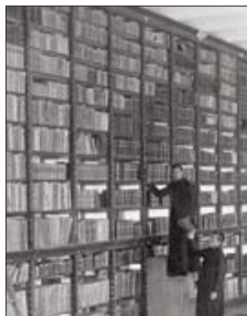
Biblioteca del Seminario.

El primer intento de recuperación se da de la mano del que llegó a ser arzobispo de la Diócesis, don Mateo Delgado y Moreno (1802-1841), en el año 1818, el cual manda ordenar la