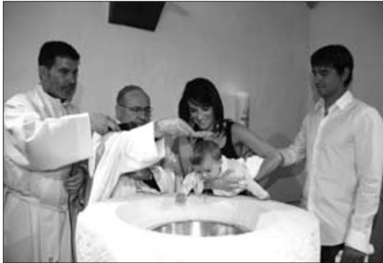
La transmisión de la fe en la familia, uno de los temas de este Sínodo.

explica también la modalidad de trabajo, cuya primera etapa será la asamblea extraordinaria de octubre de 2014, que deberá recopilar "los testimonios y las propuestas de los obispos", y la segunda será el Sínodo ordinario de 2015 que tiene como objetivo "buscar líneas operativas para la pastoral de la persona humana en la familia".