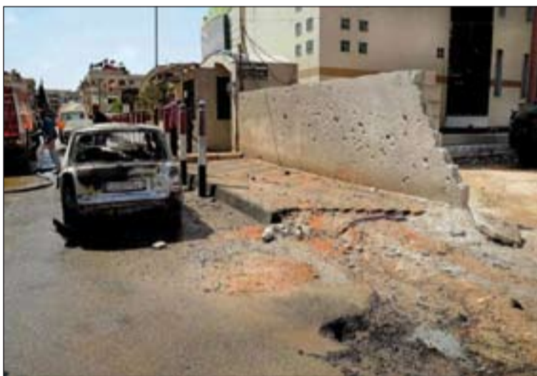
Arriba, cristiano azotado en Irak. Abajo, ataque a la Nunciatura de Damasco.