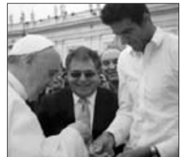
El Papa da el Rosario a Del Potro.

"Tenía mi Rosario bendecido por el Papa Francisco, que llevaba a todas partes. Es lo que más me importa", sostuvo Del Potro. ACI