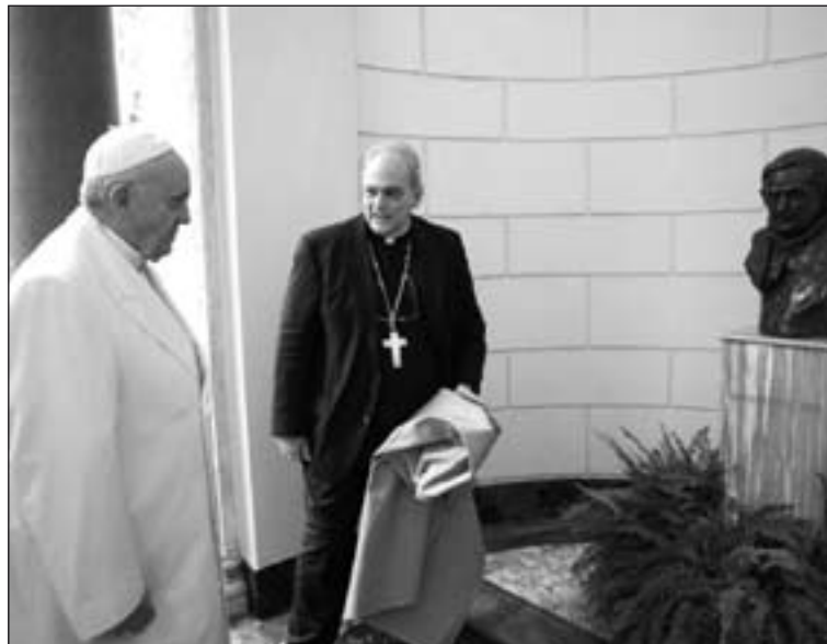
El papa Francisco ante el busto del papa Benedicto XVI

A propósito, el Pontífice ha indicado que "el inicio del mundo no es obra del caso, que debe a otro su origen, sino que deriva directamente de un Principio supremo que crea por amor". Además, ha explicado que el "Big-Bang, que hoy se pone en el origen del