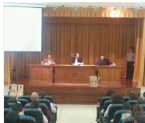
Inauguración del curso DECA en el salón de actos del Seminario.

El Instituto Superior de Ciencias Religiosas "Santa María de Guadalupe" ha iniciado el Curso DECA (Declaración Eclesiástica de Competencia Académica), en Badajoz, con 125 alumnos. El curso DECA se llevará a cabo todos los viernes por la tarde, hasta junio, en la Casa de la Iglesia "San Juan de Ribera", en Badajoz.