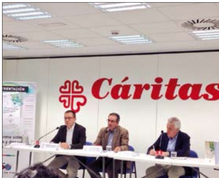
Presentación del Informe FOESSA en la sede de Cáritas Española.

Además, la crisis no ha afectado a todos por igual, ya que se ha cebado con las rentas más bajas y ha afectado a la convergencia territorial entre Comunidades Autónomas,