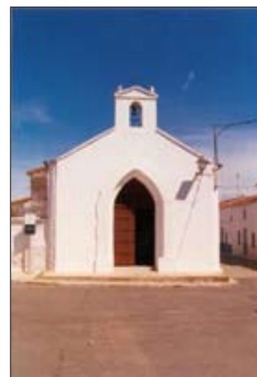
Ermita de la Magdalena.

Han sido muchos los apoyos recibidos y la ilusión popular que ha despertado.