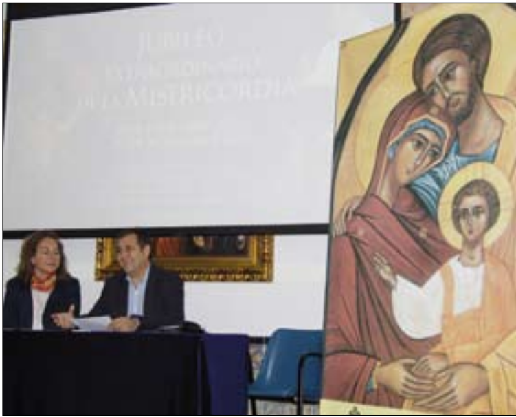
Los Delegados de Familia presentaron las actividades.