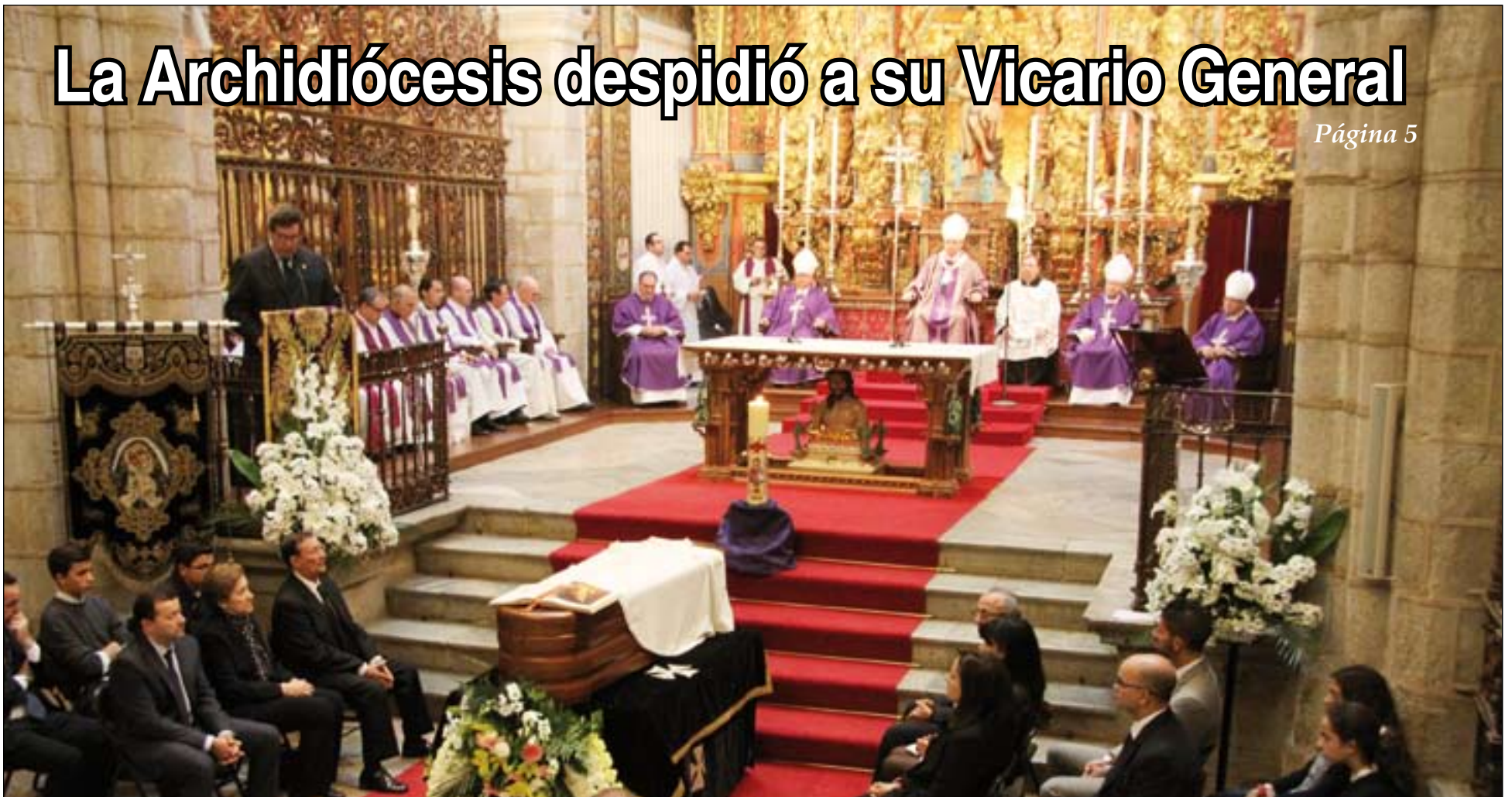
Monseñor Celso Morgia presidió el funeral.