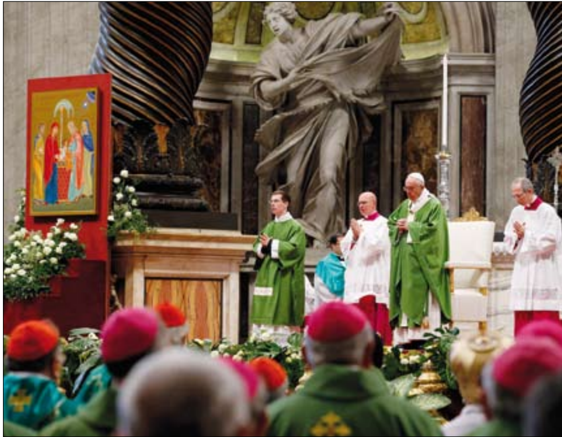
Eucaristía de clausura del Sínodo de las Familias.

La Relación final reafirma la doctrina de la indisolubilidad del matrimonio sacramental, que no es un yugo, sino un don de Dios, verdad fundada