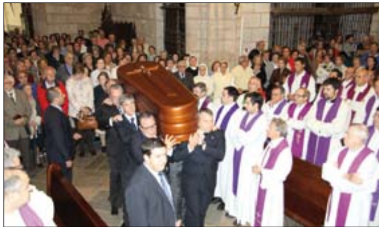
Entrada y salida del féretro en la Catedral. Arriba a la izquierda, foto reciente del Vicario General.

alegre", dijo, que basó su sacerdocio en la oración y el sacrificio. También destacó que era un sacerdote muy polifacético, ya que durante su vida trabajó en la docencia, en parroquias, en la curia y en todos los trabajos que se le encargaban, ya que "era un excelente sacerdote".