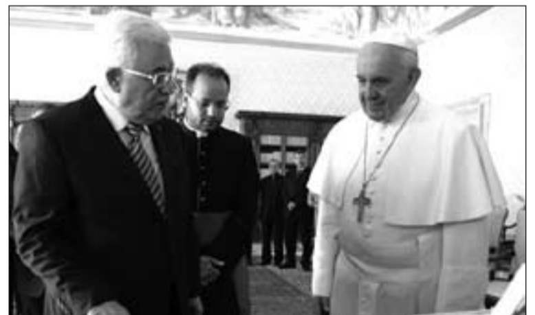
El Papa Francisco y Mahmoud Abbas, Pres. del Estado de Palestina.

En cambio se expresó "grave preocupación por la situación en Siria, para la cual se desea que la lógica de la violencia sea sustituida cuanto