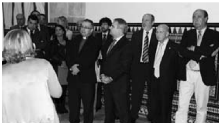
Arriba, reproducción de la Madre Teresa de Calcuta. Abajo, autoridades recorriendo la exposición.

ro en la inauguración de la exposición que corrió a cargo del Vicario General y, que contó con la asistencia de numeroso público y autoridades como el Alcalde de la ciudad, el Dele-