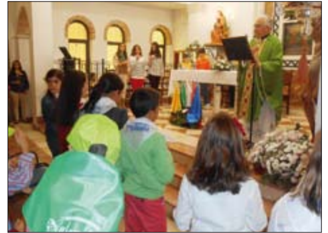
De izda. a dcha., coro del Colegio Diocesano San Atón, participantes en la III Marcha Solidaria y Eucaristía en la parroquia de Santa Eulalia, en Badajoz.

Celebración del DOMUND en la Diócesis.- El pasado domingo celebrábamos en nuestras comunidades el tradicional DOMUND de muy diversas maneras. En Iglesia en camino recogemos algunas de las actividades organizadas.