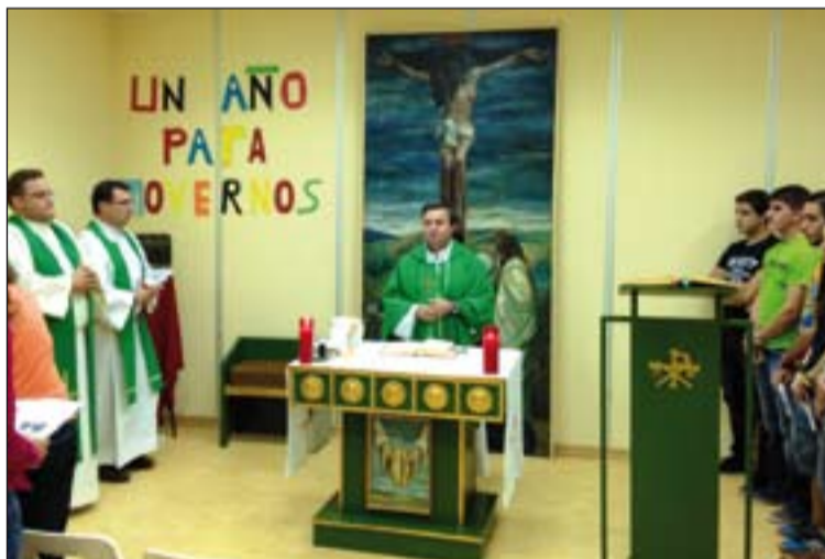
Eucaristía que se celebró en la Capilla del campus de Badajoz.

A partir de ahora todos los miércoles, desde las 11.30 horas, el Delegado estará disponible en el Despacho del Campus, junto a la Capilla, y