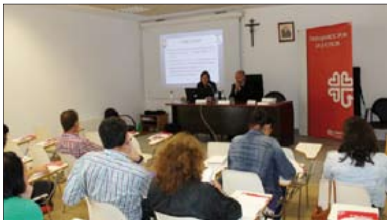
Presentación del Mapa de Recursos, durante la Jornada de Reflexión.

Este Mapa es fruto de la Red de Apoyo Mutuo de