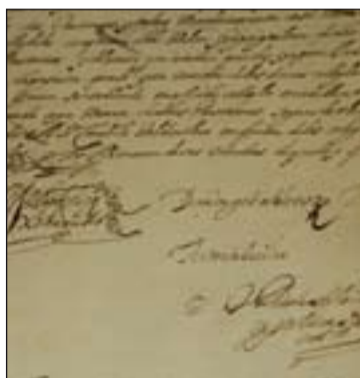
Certificado del acto de nombramiento de los primeros colegiales, donde aparecen sus firmas.