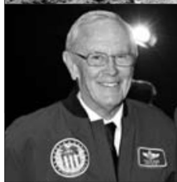
A la izquierda, Charlie Duke. Arriba, este astronauta caminando por la Luna.

de su familia durante la fase de entrenamiento, dejó una foto en la Luna, y ha apuntado que otro de los momentos felices del viaje fue el amerizaje en el Pacífico. "Si no se