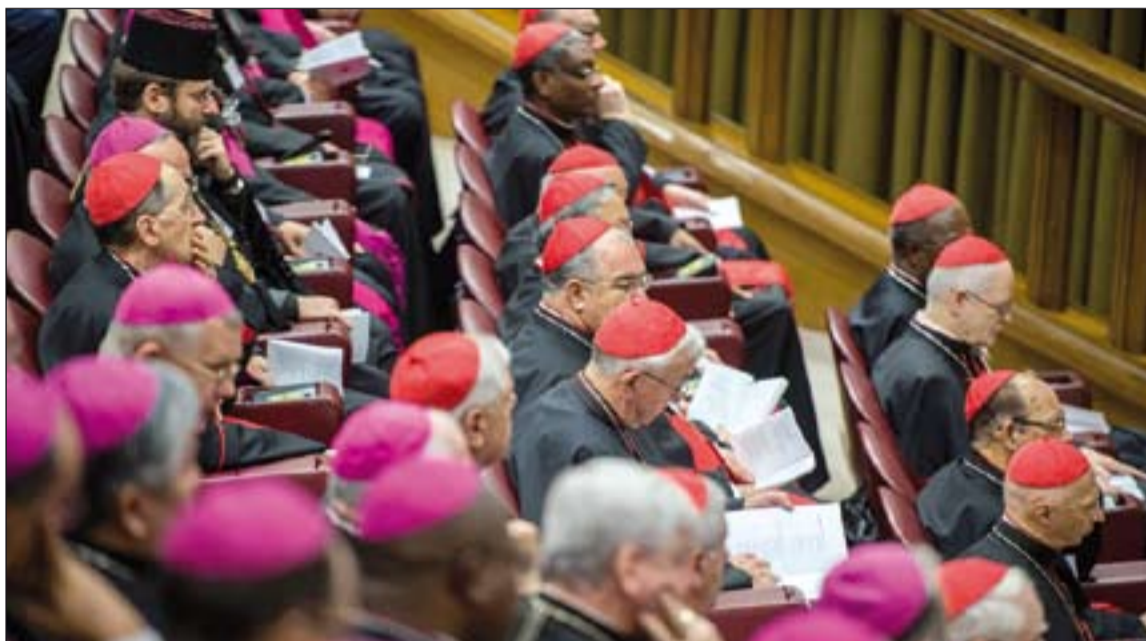
Los Padres Sinodales reunidos en una de las sesiones del Sínodo Extraordinario sobre la Familia.

le hubiera preocupado y entristecido mucho si no hubiera habido ni tensiones ni discusiones animadas, es decir, ese movimiento de los espíritus, como decía San Ignacio; si todos hubieran estado de acuerdo o taciturnos en una paz falsa y quietista.