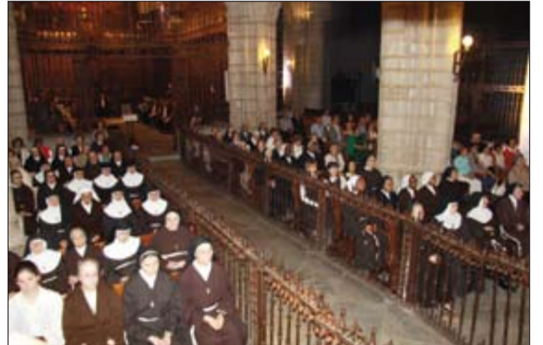
Miembros de las comunidades carmelitanas de la Diócesis que participaron en la Eucaristía celebrada en la Catedral.

-La capilla del convento de las Madres Carmelitas Descalzas en Talavera la Real