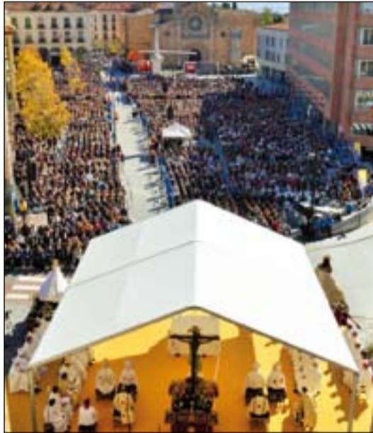
Vista general de la plaza de santa Teresa, en Ávila, durante el transcurso de la Eucaristía de clausura. En primer término, el altar.

Antes del inicio de la celebración eucarística, se vivieron dos momentos solemnes: alrededor de las 8.00 h. entraban en la Plaza los miembros del Ilustre Patronato de la Santa Vera Cruz portando la imagen del Cristo de los Ajusticiados, que presidió el altar. Justo antes de comenzar la Eucaristía,