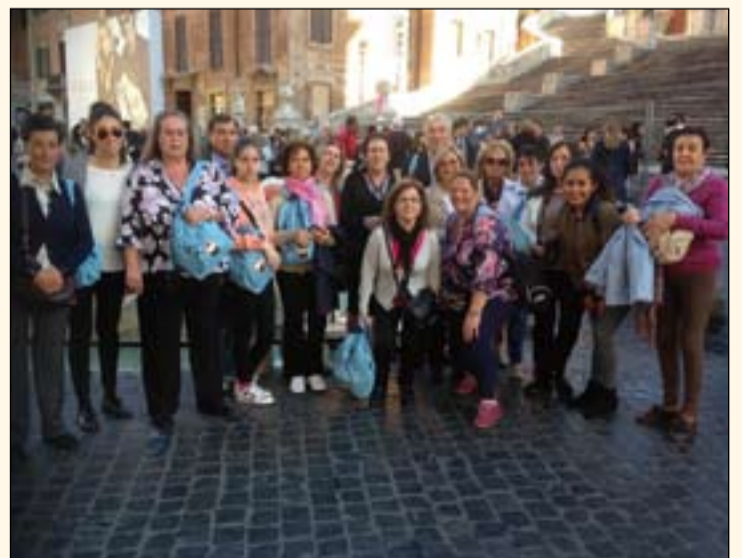
En la foto superior, grupo de peregrinos de Jerez, Oliva, Zafra, Salvaleón y Zalamea en Asís, en la de abajo grupo de Jerez en Roma.