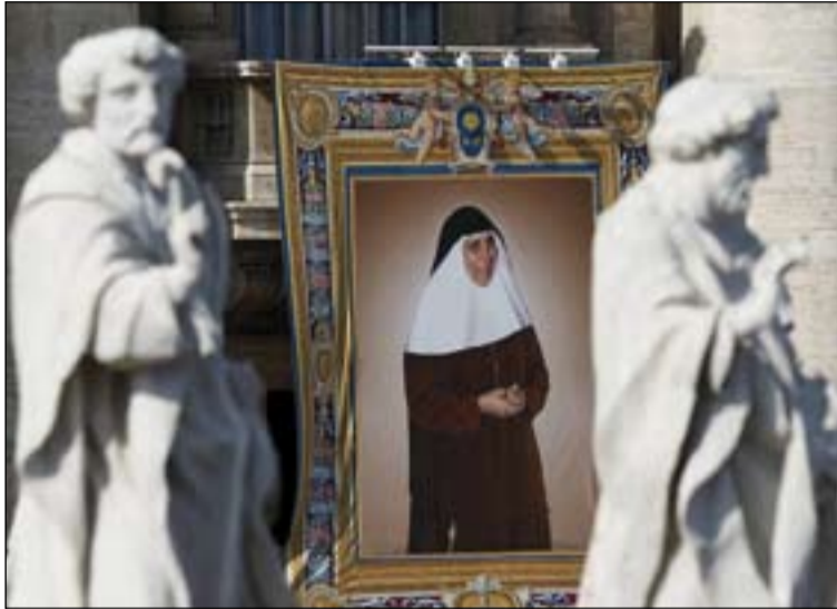
Tapiz de la Madre María de la Purísima en el Vaticano.

El Papa Francisco canonizó el pasado domingo, 18 de octubre, a la santa española Madre María de la Purísima de la Cruz, Superiora General de la Congregación de las Hermanas de la Compañía de la Cruz, quien dedicó su vida a atender a los pobres, los enfermos y a los más necesitados