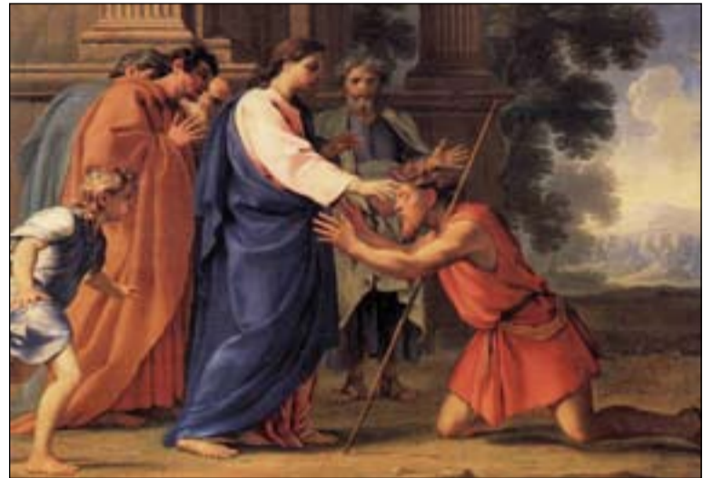
Cristo que cura al hombre ciego. Eustache Le Sueur (s. XVII)

Y al momento recobró la vista y lo seguía por el camino.