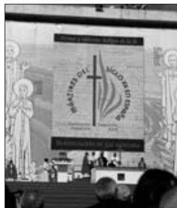
Ceremonia de beatificación.

La familia claretiana de nuestra Diócesis, dos de cuyos miembros nacidos en Mérida-Badajoz fueron beatificados el domingo, se sumará a los actos de acción de gracias que esa Congregación ha organizado este fin de semana en Sevilla para toda la provincia Bética. Allí se trasladarán alrededor de un centenar de personas de Almendralejo, donde los claretianos cuentan con una comunidad. Por su parte la familia marista, uno de cuyos miembros fue martirizado en Badajoz, organizó el lunes una con-