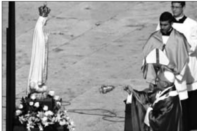
El Papa Francisco ante la imagen de la Virgen de Fátima.

El Papa con su hábito blanco salió a la plaza en medio de los aplausos y monseñor Fisichella recordó nuevamente que "la Virgen se hizo peregrina con los peregrinos".