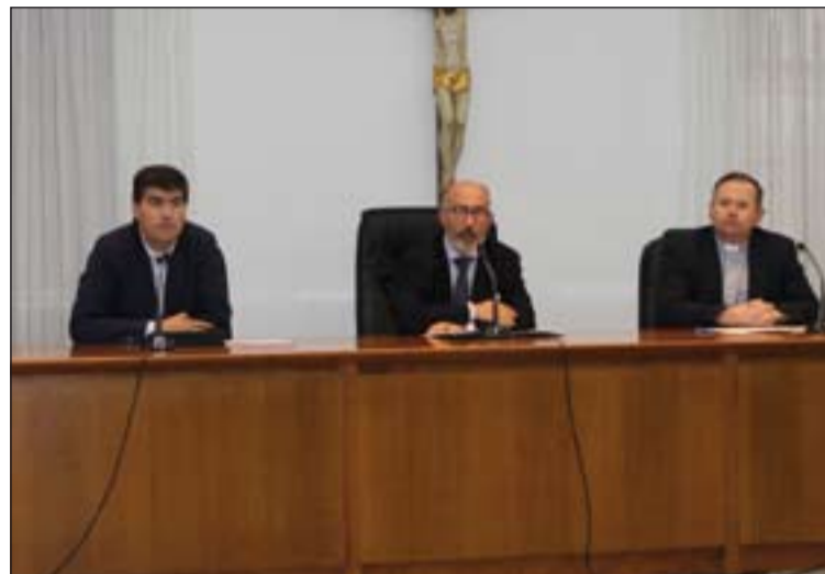
Presentación de la Jornada de Reflexión que se celebrará el lunes.

Otro de los datos a destacar de este Estudio es el referente al paro. Indica que se ha producido un incremento en el