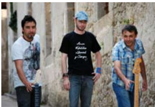
Componentes de Alkalinos.