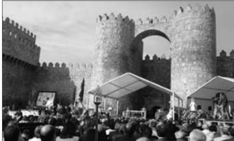
Eucaristía inaugural del Año Jubilar Teresiano en Ávila.

Todas las diócesis españolas se han unido a esta celebración que tendrá los siguientes momentos de especial relevancia: la peregrinación de todos los obispos españoles a Ávila el 24 de abril de 2015 y el Encuentro Europeo de Jóvenes, del 5 al 9 de agosto, en la ciudad que vio