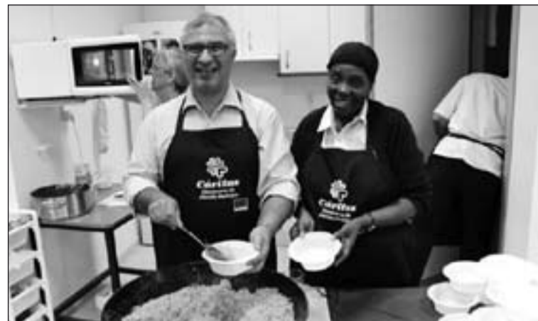
Alumnos del Curso de Pinche que se imparte en el Centro de Empleo.

Desde que comenzó este año se han atendido a 177 personas, de las cuales 23 se han insertado en el mercado