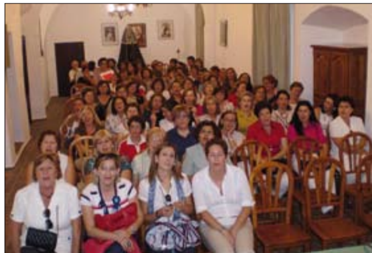
Catequistas que participaron en este encuentro.