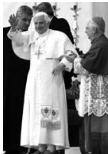
Benedicto XVI en Lamezia Terme.

"No podemos aceptar que en nuestra tierra se refuerce el dominio de los poderes criminales, la empresa buena sea expulsada por la mala y contaminada, el capital ilegal sustituya