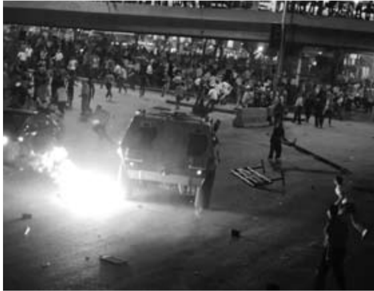
Manifestantes cristianos en un enfrentamiento con la policía egipcia.

Al día siguiente del ataque, As-Sayyed, en vez de condenar el ataque, afirmó que "no ha habido ningún ataque porque en Assuan no hay iglesias", según la web cristiana Coptreal. Tales declaraciones fomentaron la indignación copta que condujo a la manifestación que partió del barrio de Shabra hasta la sede de la televisión nacional, pidiendo la tutela del estado para los lugares de culto cristiano y la paridad de derechos para todos los