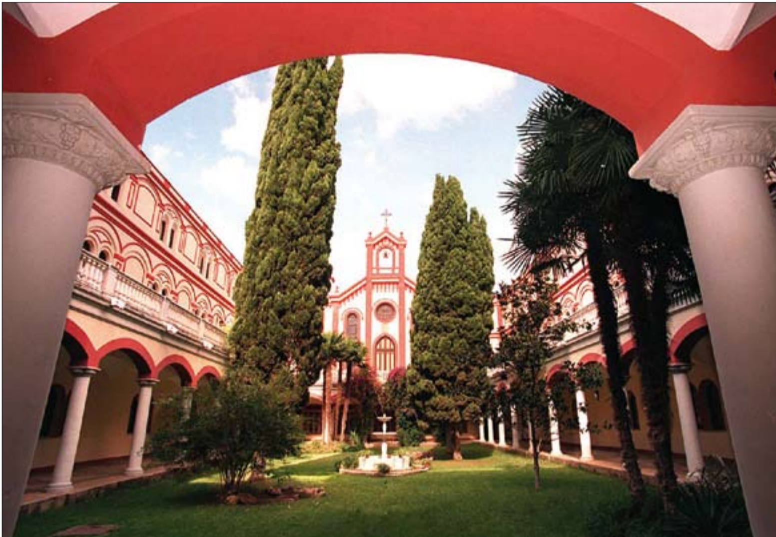
Claustro del Seminario Metropolitano de San Atón, en Badajoz.

■ El viernes se inauguraba el curso oficialmente en los centros educativos de la Archidiócesis: Seminario, Centro Superior de Estudios Teológicos, Instituto Superior de Ciencias Religiosas, Escuelas de Formación Básica y Colegios diocesanos.