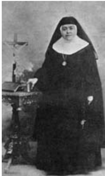
Beata Bonifacia Rodríguez Castro