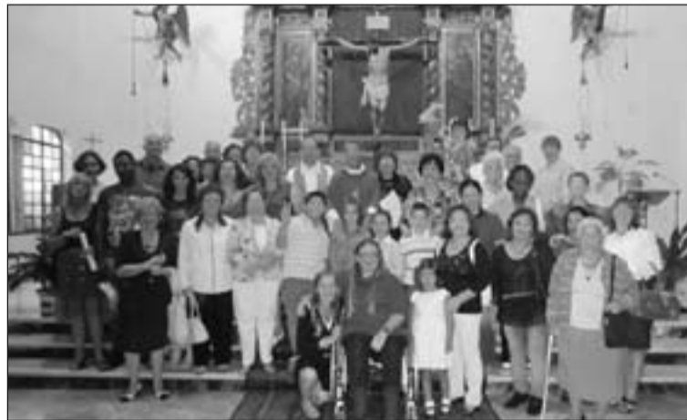
Participante en la Eucaristía.

De este primer encuentro en Mérida se hizo una valo-