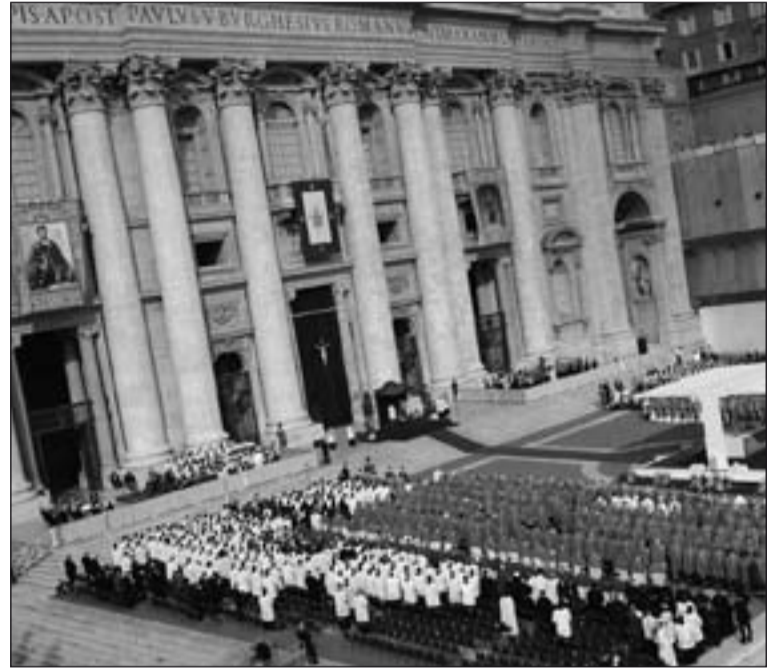
Eucaristía en la plaza de San Pedro con la que ha comenzado el Sínodo.

Como teólogo también el Papa reconoció que el presbítero español "supo penetrar con singular profundidad en los misterios de la redención obrada por Cristo para la humanidad", reconociéndolo como "Hombre de Dios, que unía la oración constante con la acción apostólica". Recordó cómo estuvo dedicado a la predicación y al incremento de la práctica de los sacramentos, "concentrando sus