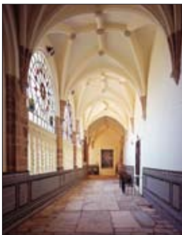
Claustro de la Catedral de Badajoz, donde fue convocada la manifestación de los estudiantes de Gramática.

Hasta el año 1610 no se encuentra una solución, que sería provisional: la aportación económica de la fundación de don Sancho de Fonseca que dará