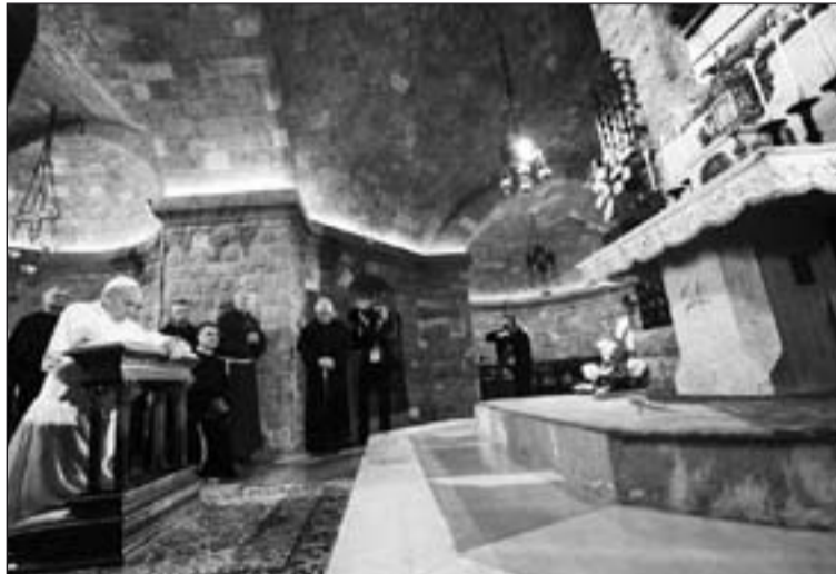
El Papa rezando ante la tumba de San Francisco, en Asís.

El papa Francisco comenzaba muy temprano su jornada en Asís: en torno a las 8 de la mañana llegaba al Instituto Seráfico, donde se reunía con los niños y los trabajadores de este centro para personas discapacitadas físicas y mentales, a quienes saludó con el