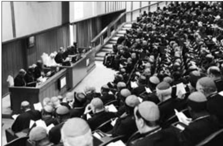
Sínodo de los Obispos celebrado el año pasado.