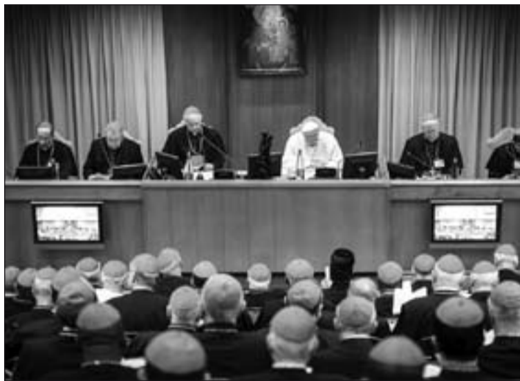
Apertura del Sínodo Extraordinario de los Obispos sobre la familia.

Este sínodo sobre la familia abarca muchos aspectos, desde los jóvenes que no se casan, a los ancianos y discapacitados en las familias, pasando por el descenso de la natalidad que se registra en los países industrializados. Otros temas que afectan a millones de personas son la familia en las migracio-