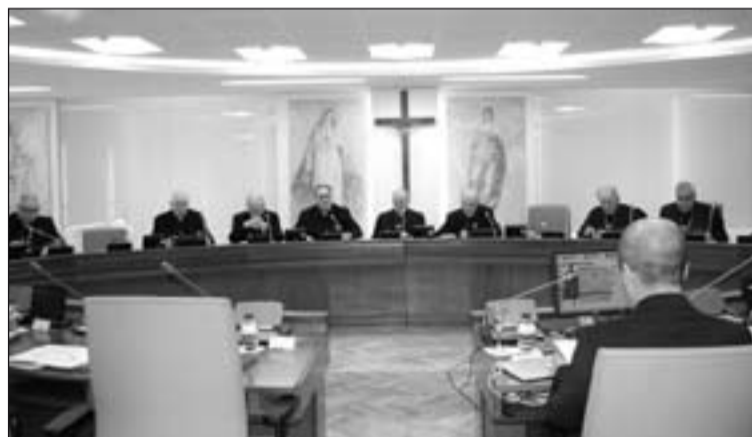
Reunión de la Comisión Permanente de la CEE.

Por otro lado, la Junta Episcopal para el V Centenario de Santa Teresa de Jesús sigue trabajando para programar diversas actividades en toda España. Ya están aprobadas: la inauguración, que será el próximo miércoles; el Jubileo de los Obispos, el 24 de abril; el Encuentro Europeo de Jóvenes, del 5 al 9 de agosto; y la clausura del Año Jubilar, el 15 de octubre de 2015.