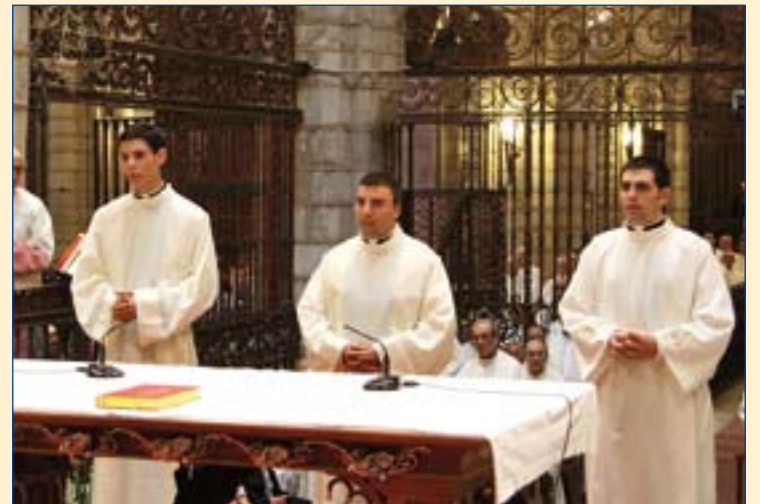
Los tres jóvenes diáconos.

afirmó en la homilía que este Año Sacerdotal "nos ha acercado a la contemplación de las íntimas relaciones eclesiales que existen entre los sacerdotes y la vida de los fieles" y ha servido "para crecer en la unidad y en la comu-