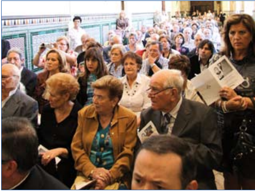
La clausura de la fase diocesana contó con la asistencia de numeroso público.

so de canonización que "la Iglesia obra en justicia, reconociendo el honor que estos sacerdotes, seminaristas, religiosos y seglares merecieron en su momento".