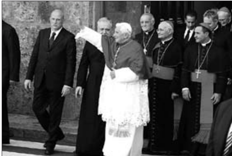
Benedicto XVI saludando a los fieles en su visita a Palermo.

Dirigiéndose en particular a los laicos, el obispo de Roma les exhortó: "¡no tengáis te-