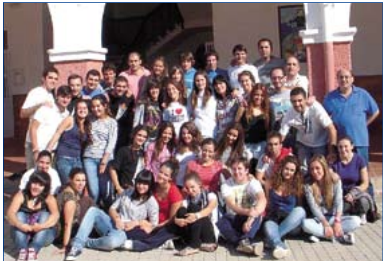
Participantes en el encuentro.

En esta convivencia también hubo tiempo para la oración, ofreciendo lo vivido