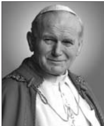
Juan Pablo II

El papa en su viaje de regreso de la Jornada Mundial de la Juventud en Río de Janeiro, había indicado la fiesta de la Divina Misericordia, el 27 de