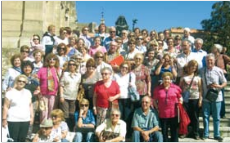
Participantes en el viaje.

Dentro de este viaje destacó la visita que realizaron a la triple sede de la exposición "Las Edades del Hombre" en Arévalo, que destaca por su valor artístico, catequético y didáctico.