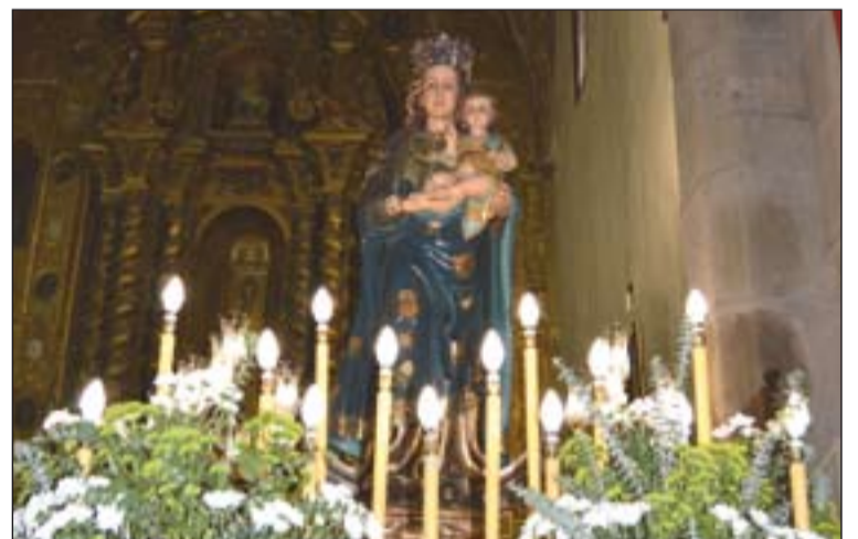
Ntra. Sra. de Armentera antes de procesionar por las calles del pueblo.

mingo, después de un triduo, tuvo lugar la procesión con Nuestra Señora de Armentera, titular de la Parroquia desde 1515 y Patrona del pueblo has-