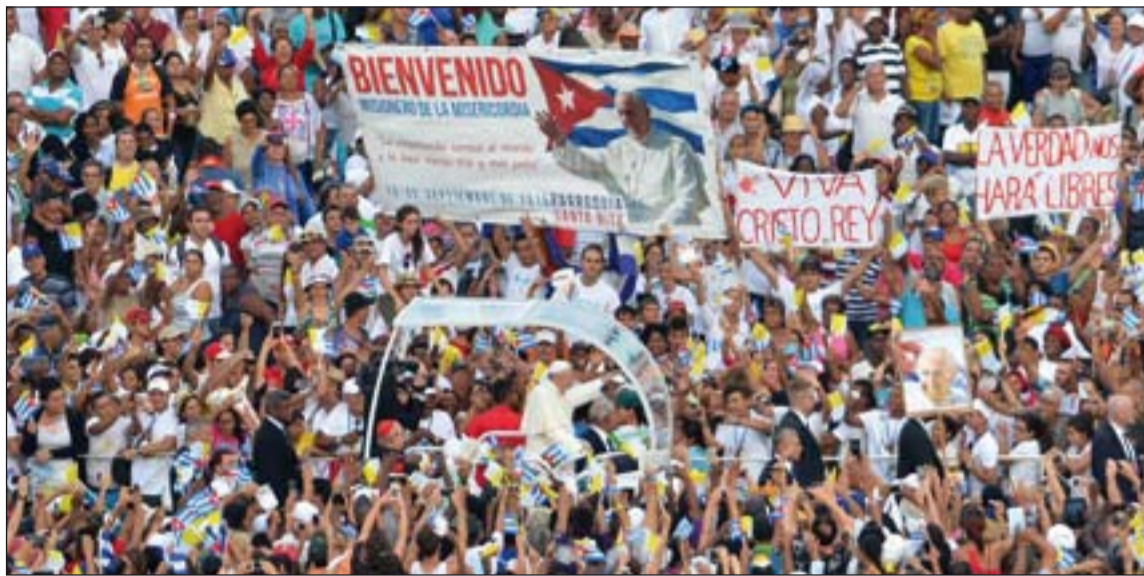
El papa Francisco saluda a los fieles tras la Eucaristía en la plaza de la Revolución, en La Habana.