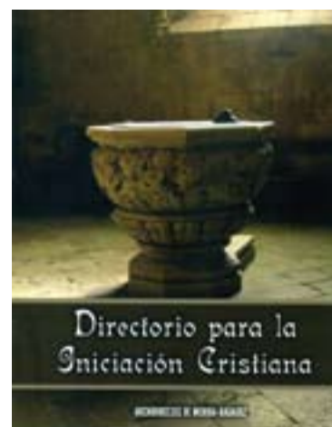
Portada del nuevo directorio.

La Coordinadora será espacio privilegiado para la evaluación de la marcha del proyecto y para compartir experiencias y materiales entre