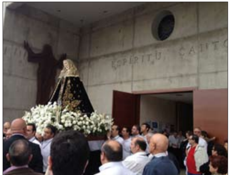
La Virgen de la Soledad a la entrada de la parroquia del Espíritu Santo.

mandad encontramos también durante el pasado curso la celebración, en la ermita una semana mariana y misionera, a cargo de los padres claretianos.