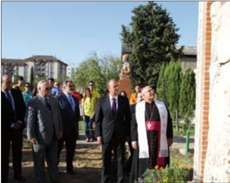
Don Santiago bendijo un monolito conmemorativo de la visita.

Estuvieron también en Puebla de la Calzada y Mérida