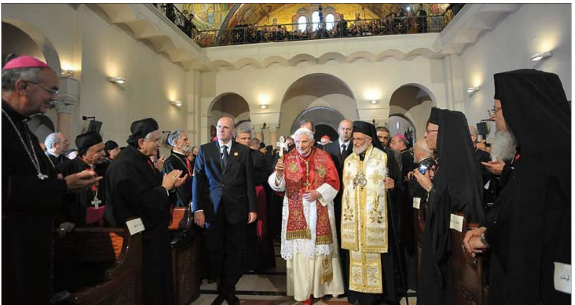
Benedicto XVI entrando en la Basílica de San Pablo en Harissa, durante su viaje al Líbano.