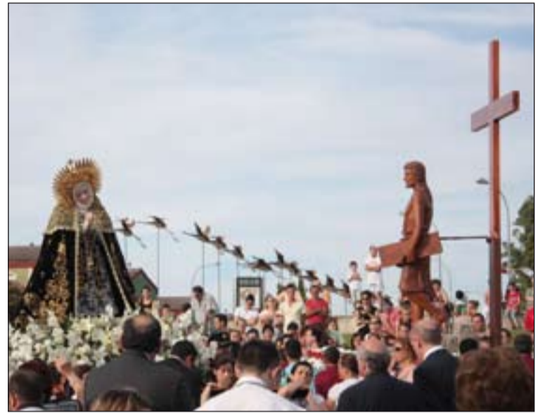
La Virgen de la Soledad en el Cerro de Reyes con la imagen de Jesús Obrero.

Como acciones destacadas, en el calendario de celebraciones organizado por la Her-