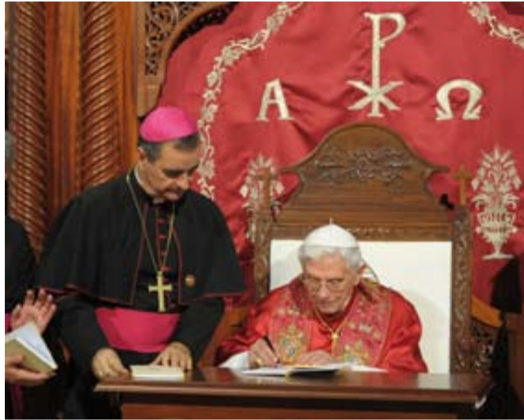
Benedicto XVI firmó la Exhortación Apostólica Postsinodal de la Asamblea de los Obispos para Oriente Medio.

deres del país en el palacio presidencial de Baabda Benedicto XVI volvió a incidir en lo mismo, los animó a trabajar por la paz porque Dios quiere la paz y nos confía la paz. Con la palabra paz abrió y cerró su discurso en el que la repitió al menos treinta veces. "No se puede consentir que el mal triunfe por la pasividad de los hombres de bien", les dijo el Papa a los miembros del gobierno, de las instituciones de la República, el cuerpo diplo-