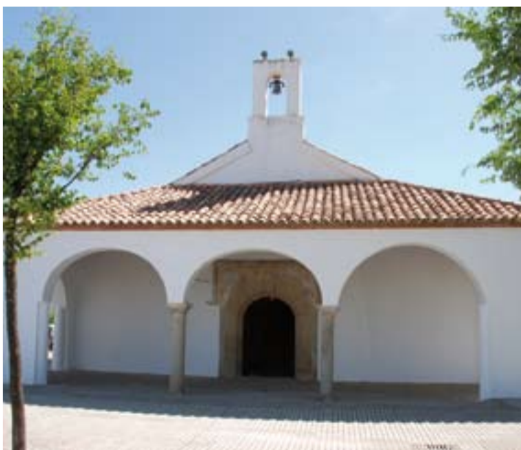
Exterior de la ermita de San Roque.

Gracias a esta restauración se han encontrado en el presbiterio pinturas murales decorativas que se encontraban