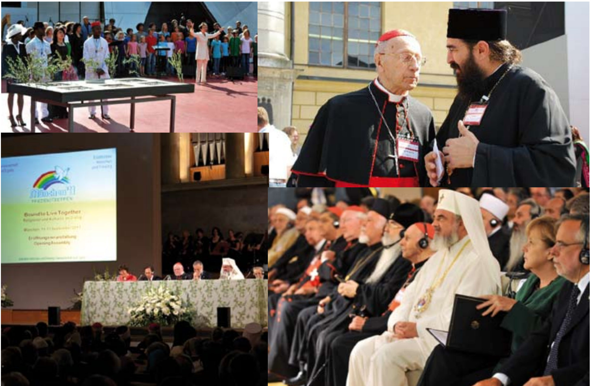
Diversos momentos del encuentro interreligioso de Múnich celebrado esta semana.

AÑO XVIII • Nº 863 • SEMANARIO DE LA ARCHIDIÓCESIS DE MÉRIDA-BADAJOZ • 18 DE SEPTIEMBRE DE 2011