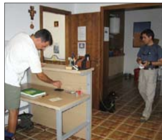
Instalaciones del albergue de Monesterio

que fue trasladada hasta la parroquia, donde ha permanecido todo este tiempo. Una vez finalizada la restauración, la imagen del santo fue llevado hasta su ermita en procesión, acompañado por cientos de vecinos.