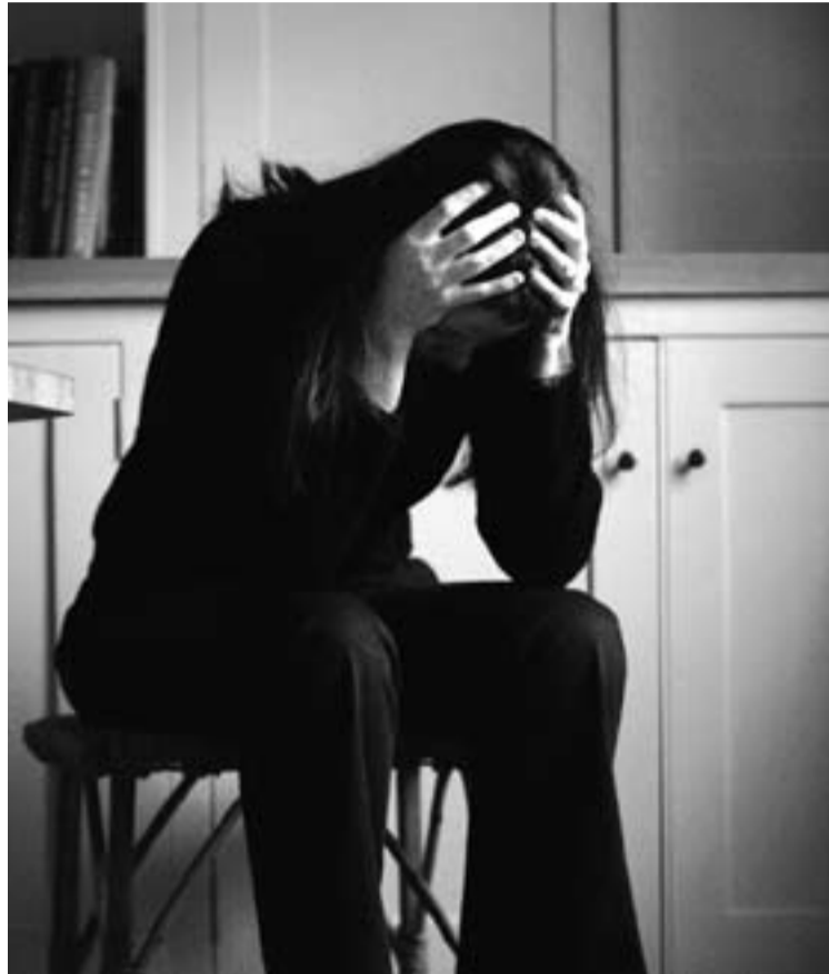
La mujer que aborta termina convirtiéndose en víctima de su acción.

El estudio lleva el título de "Aborto y salud mental: Síntesis cuantitativa y análisis de investigaciones publicadas entre 1995-2009" y el número total de las participantes es de 877.181, de las cuales 163.831