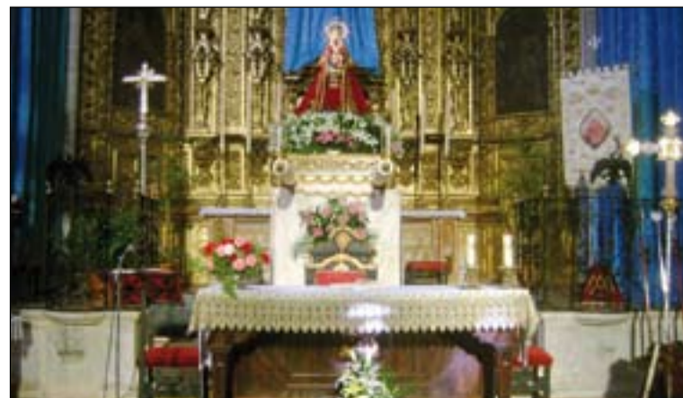
Arriba, la Virgen de Barbaño en Montijo. Abajo, la Virgen de Finibus Terrae en Almendral.