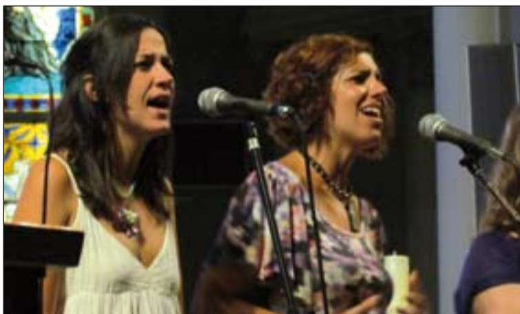
Concierto de Ixcís durante la JMJ celebrada en Madrid.