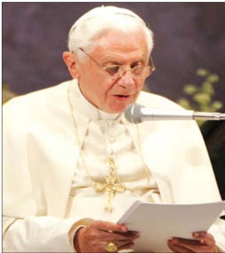
Benedicto XVI pronunciando un discurso.

Al día siguiente el Santo Padre abundaba en su condena de todo tipo de terrorismo en el mensaje que dirigía a los participantes del encuentro "Bound to live together. Religiones y culturas en diálogo", que cada año organiza la Comunidad de San Egidio, esta vez en la ciudad alemana de Múnich, para mantener vivo el "espíritu de Asís" y el mensaje de paz lanzado por Juan