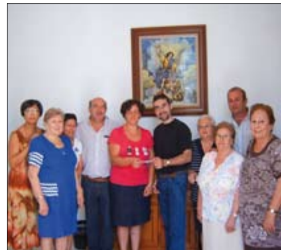
Miembros de Cáritas Interparroquial Zafra hacen entrega del dinero recaudado al técnico de Cáritas diocesana.

Ante esta interpelación cientos de vecinos de Zafra, se solidarizaron con el sufrimiento de estas miles de personas del Cuerno de África y durante las eucaristías de los días 13 y 14 del mencionado mes se oró y se compartió en solidaridad con estos pueblos que mueren de hambre.