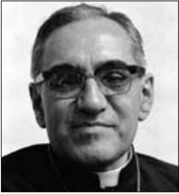
Monseñor Oscar Romero