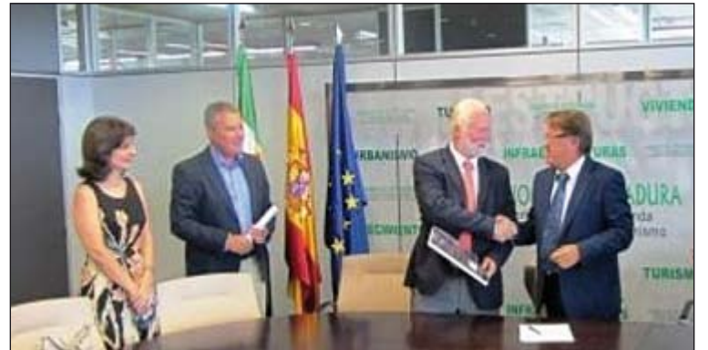
Acto de entrega de las llaves por parte de la Consejería de Fomento.

En este piso convivirán cuatro personas, ahora en acogida, y cuyo nivel de habilidades sociales y problemática permite que puedan normalizar su situación. Principalmente se trata de personas enfermas que no tienen o no pueden estar con sus fa-