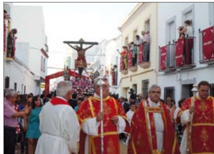
Procesión del Cristo de las Misericordias por las calles de Fuente del Maestre.

Después de 20 años, el Santísimo Cristo de las Misericordias procesionó por las calles de Fuente del Maestre entre el fervor popular. La procesión estaba programada para el 7 de septiembre pero un fuerte aguacero obligó a suspenderla. Fue al día siguiente cuando los vecinos de esta localidad pudieron ver procesionar por sus calles y plazas engalanadas a su Patrón, una bella imagen mejicana del siglo XVI.