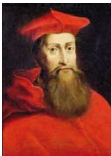
Cardenal Reginaldo Pole.

En 1563, durante el Concilio de Trento, nació una de las instituciones más señeras y emblemáticas en la historia de la formación sacerdotal; pero no olvidemos la recurrencia tomada de la tradición patristica y monacal, de las escuelas epis-