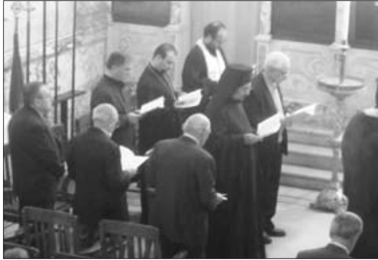
Fieles de varias confesiones participan en la oración por la paz en Siria

El Nuncio consideró que la vigilia tendrá un fuerte impacto: "Veo aquí que la iniciativa del Papa y sus palabras tuvieron un eco extraordi-