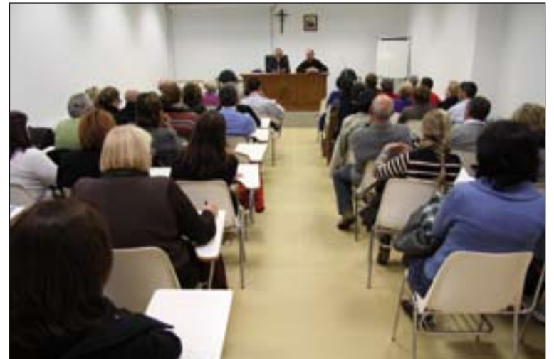
Apertura del curso pasado en las EFB.

A un nivel inferior se encuentran las Escuelas de Agentes de Pastoral, pensadas para aquellas personas que ya poseen una formación cristiana básica y desean pro-