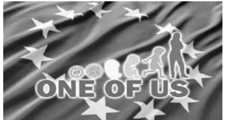
Logotipo de la Federación.

Se puede obtener más información en http://www.oneofus.eu/es/ . ACI