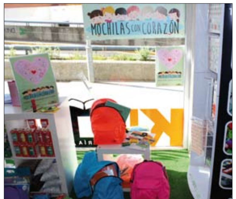
Apartado para "Mochilas con Corazón" en la papelería Kutter.

El material escolar se puede entregar en la sede la Junta de Cofradías, que se encuentra en la calle Cava, de 18.00 h. a 21.00 horas, también por las tardes y los sábados por la mañana puede