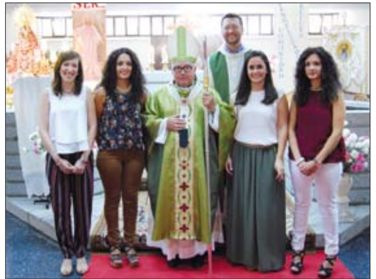
Las cuatro jóvenes, junto al Arzobispo y a su párroco.

El paso a la militancia supone una manifestación pública del compromiso cristiano. Las nuevas militantes, han dado este paso después de llevar un tiempo conociendo las herramientas de la ACG y realizar un retiro espiritual en Cabezuela del Valle, a principios del curso pasado, acompañadas por militantes y consiliarios. Continuaron formándose para adquirir una mayor implicación con su parroquia, con la ACG y con la diócesis, y así seguir madurando en