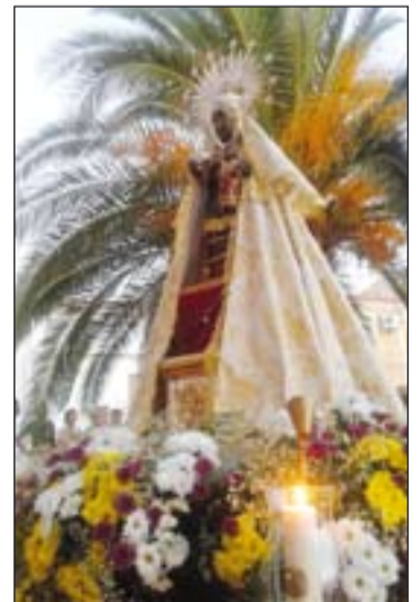
La imagen en procesión.