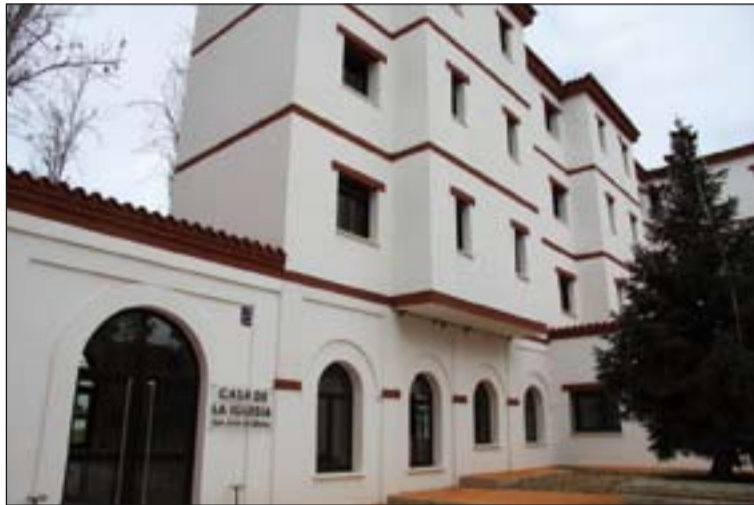
La Casa de la Iglesia, en Badajoz, sede central del ISCR.

El Instituto se viene convirtiendo en la referencia educativa en la Archidiócesis, ya que además de estos estudios organiza el curso DECA, que capacita a los profesores para dar clases de Religión. Como