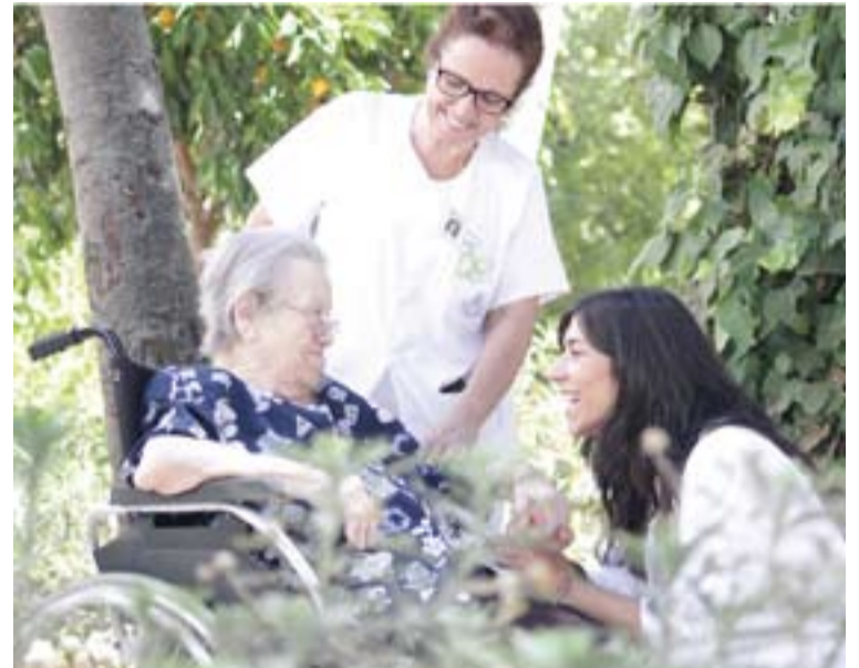
La Orden cuenta en Almendralejo con una residencia de ancianos y hospital.