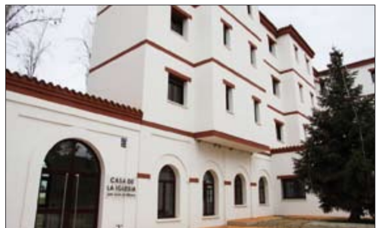
Casa de la Iglesia s. Juan de Ribera, sede de Badajoz del ISCCRR

El pasado curso el Instituto superior de Ciencias Religiosas contó con 110 alumnos, 75 de ellos en Badajoz. Su director ha manifestado que ese número crecerá significativamente este año. El plazo de matrícula estará abierto hasta el 25 de septiembre.