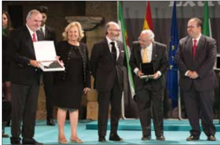
Representantes de los Bancos de Alimentos y las Cáritas diocesanas.