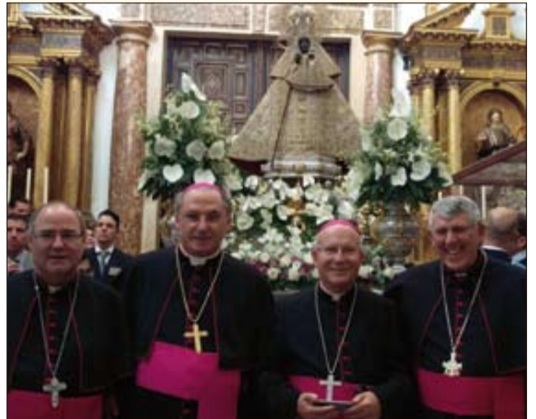
Los obispos con jurisdicción en Extremadura delante de la virgen morenita.

Tras la Misa tenía lugar la tradicional procesión de la Virgen por el claustro mu- dejar del monasterio.