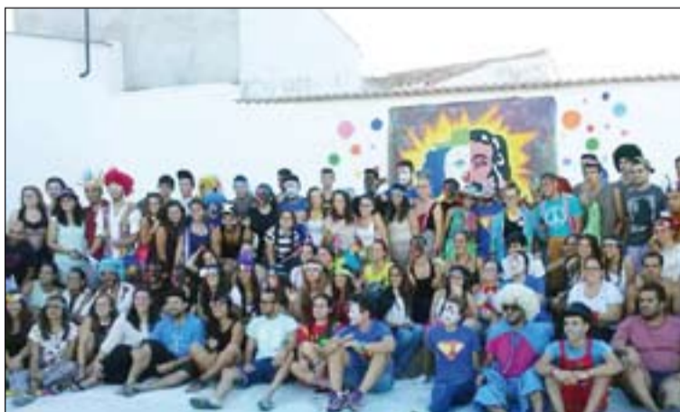
Participantes en este campamento.

Durante una semana, repleta de actividades y valores, en torno a 70 jóvenes provenientes de diversos lugares (Puebla, Montijo, Villafranca, Barcelona, Palma de Mallorca, Talavera, Guadajira, Ba-