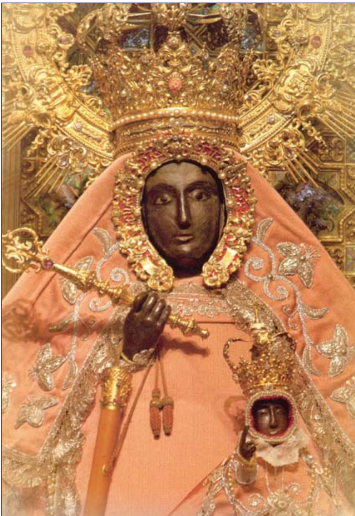
Virgen de Guadalupe