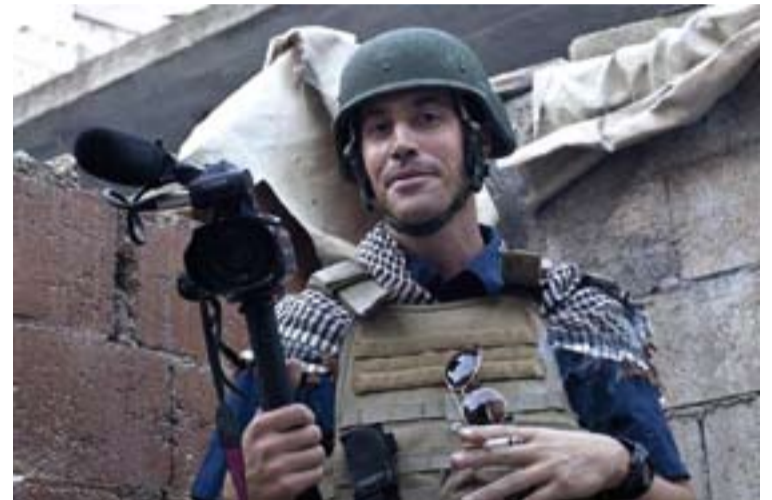
James Foley, periodista asesinado en Irak.