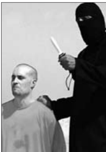
James Foley fue decapitado por los integristas del Estado Islámico.