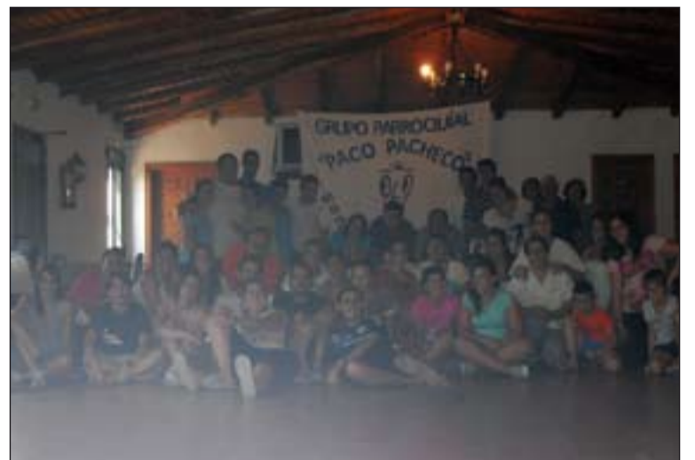
Jóvenes participantes en el campamento en San Vicente de Alcántara.

Durante varios días los niños y jóvenes se convirtieron en caballeros de la Orden de Santiago y trabajaron, a través de juegos, deportes, talleres y