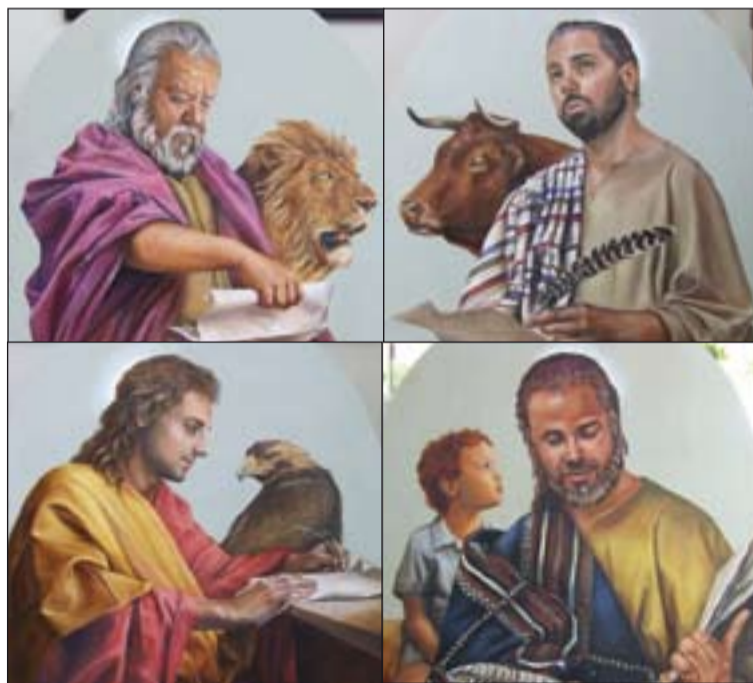
Pinturas de los cuatro evangelistas.

"Estas pinturas tienen una carga simbólica muy importante con las que el artista ha sabido reflejar los mensajes de los evangelios", afirma el