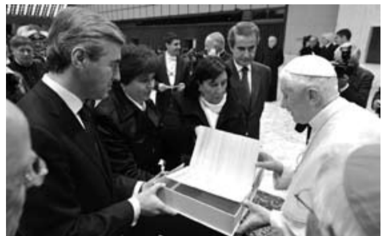
Benedicto XVI recibe a un grupo de laicos tras una audiencia.

Por ello, les hace una llamada a la santidad y a una