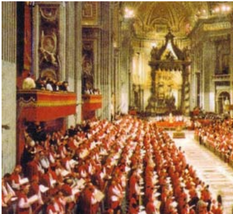
El Concilio Vaticano II cumple este año su 50 aniversario.

Antes, el 7 de octubre, será en Roma la proclamación de San Juan de Ávila como Doctor de la Iglesia, a la que