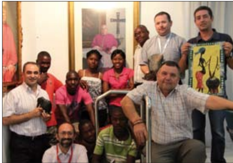
Jóvenes de Zimbabwe que visitaron la Diócesis con motivo de la JMJ.

Por su parte, en la memoria presentada por la Delegación episcopal para la Cooperación Misionera se detalla cada una de las actividades desarrolladas por esta delegación durante el pasado curso pastoral. Un curso que comenzó con la visita de jóvenes de Zimba-