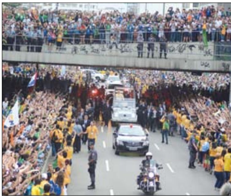
Las calles de Río de Janeiro se llenaron para saludar al Papa Francisco.

A su llegada el Santo Padre fue recibido por las altas autoridades del hospital. Luego quiso detenerse a rezar en la capilla del hospital, para encontrarse posteriormente en el patio central con los miembros de la Venerable Tercera Orden de San Francisco de la