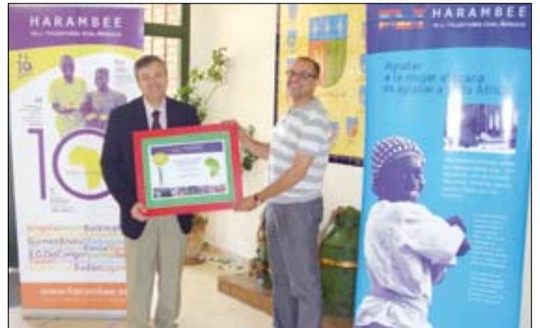
La ONG Harambee entrega el premio al colegio "Tomillar".

Por otro lado, la comunidad educativa del Colegio San José, de la Compañía de Jesús, en Villafranca de los Barros vuelve a estar de enhorabuena por motivos académicos, a