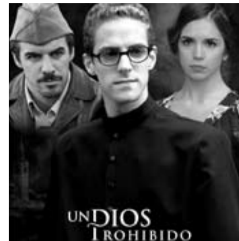
Cartel de la película "Un Dios prohibido".

GRU 2: MI VILLANO FAVORITO. EEUU (2013). Dirección: Pierre Coffin y Chris Renaud. Vuelve a proponer nítidamente fórmulas de dudosa corrección política: las niñas necesitan "una madre" y no un "progenitor B", y quie-