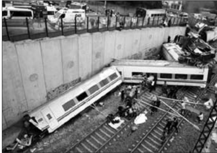
Tren siniestrado cerca de Santiago de Compostela.

Pedimos también por el restablecimiento de los heridos y por todos los que están pres-