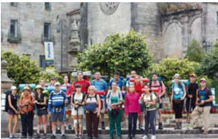
Peregrinos de la Parroquia de Fuentes de León camino de Santiago.