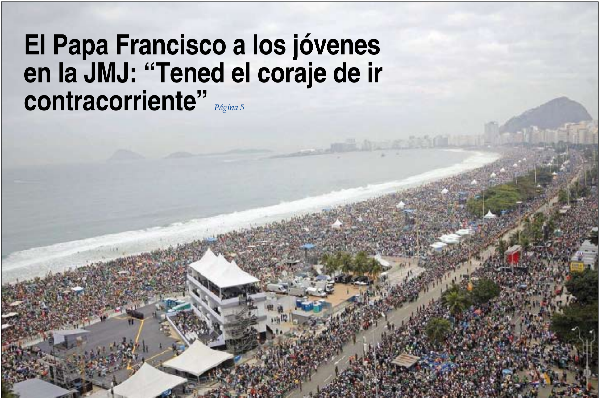
Aspecto que presentaba la playa de Copacabana durante la vigilia del Papa con los jóvenes.