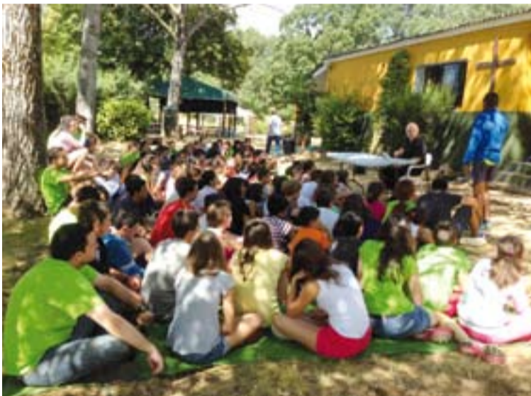
Encuentro que mantuvo el Arzobispo con los niños participantes en el Campamento Damasco.

Por su parte, el día 31 de julio, tras la marcha de los participantes del Campamento Damasco, comenzó el Campamento Emaús, con la participación de 115 jóvenes de 15 a 20 años. El Campamento de Emaús está viviendo la experiencia en torno a María, como modelo de fe.