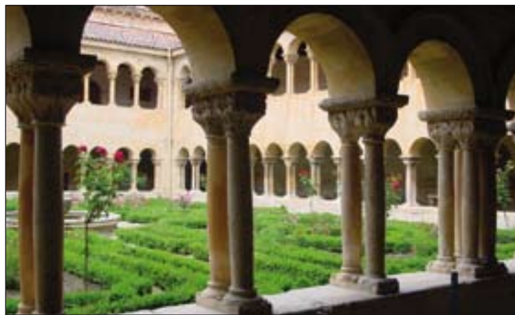
Monasterio de Silos.