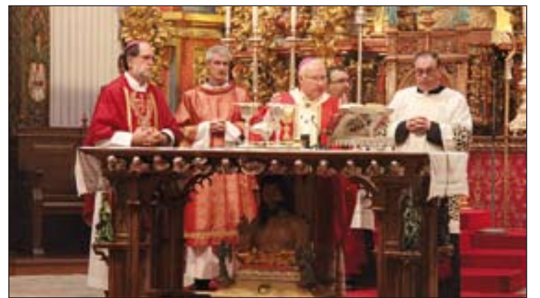
El Arzobispo, centro, acompañado por el obispo de Cajamarca, izda.