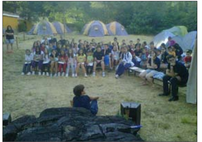
Celebración de la palabra en el Campamento Damasco.

Por su parte, los adolescentes mayores de 15 años que hayan participado o deseen hacerlo en las actividades que el Proyecto Emaús, dentro del PDAV, celebra durante todo el curso participarán del 1 al