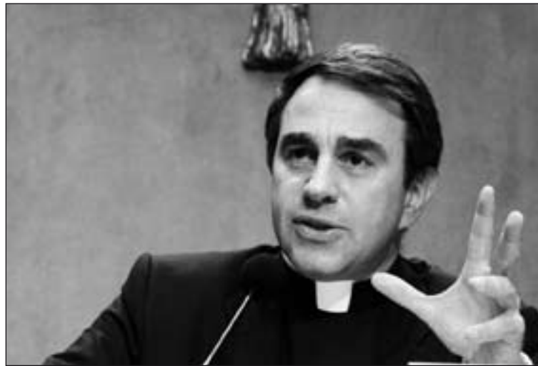
Monseñor Ettore Balestrero

Al enumerar los resultados principales, Moneyval elogió la labor de la Santa Sede al haber "recorrido un largo camino en un periodo de tiempo muy breve y muchos de los elementos constitutivos del propio sistema AML/CFT están actualmente formalmente en vigor".