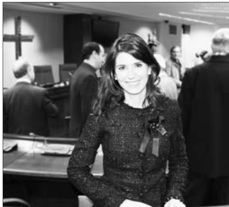
Bárbara en una entrega de Premios ¡Bravo! en la CEE.

"¡Ganaremos vida mía, ganaremos! Hoy nos queda lo más difícil: buscarle sentido a todo esto que nos ha pasado".