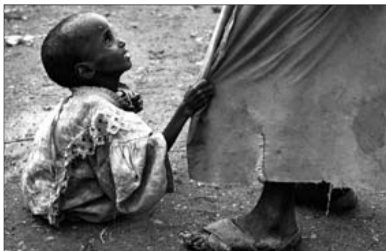
500.000 niños están en riesgo inminente de muerte.

once millones de personas en Kenia, Etiopía, Yibuti, Uganda y Somalia están en riesgo de hambruna.