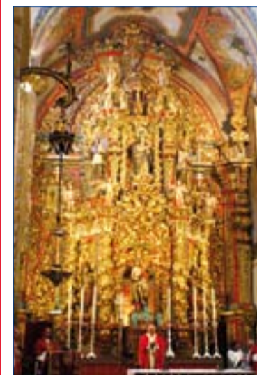
El Arzobispo preside la Eucaristía en el día de su onomástica

4. Rogar o practicar un pequeño o gran esfuerzo para concelebrar y/o participar dicho día en la Eucaristía a las 12 horas en la S.I. Catedral metropolitana y, tras la celebración de la misma, felicitar a nuestro arzobispo en el Claustro catedralicio, practicando así un gesto de comunión eclesial con el Pastor diocesano.