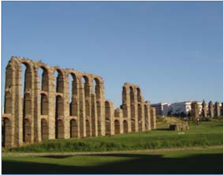
Acueducto de los Milagros, acogerá el último acto de los DED.

Entre las actividades que se preparan destacan dos visitas a Guadalupe, por parte de jóvenes de La Serena con los mejicanos acogidos por ellos y de la zona de Mérida-Vegas Bajas con jóvenes de India. Esta visita tendrá particular interés para los peregrinos procedentes de México. Por otra parte las zonas de Tierra de Barros-Campiña Sur y la de Raya-Sierra Suroeste con jóvenes de EEUU, Filipinas y Zimbabue visitarán Tentudía y tendrán un día de convivencia en Monesterio. Finalmente la zona de Badajoz (que incluye el arciprestazgo de Alburquerque) y los jóvenes polacos que serán acogidos, así como los jóvenes de Mérida-Vegas Bajas disfruta-