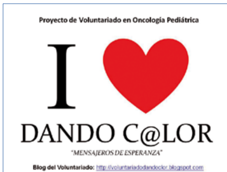
Imán "Dando C@lor".

Para que esta campaña salga adelante este proyecto solicita la ayuda de empresas que se unan a la campaña haciendo llegar a sus clientes dichos imanes y el tríptico que lo acompaña por el módico precio de 2 euros, dinero que se destinará íntegramente al voluntariado y todas las activida-