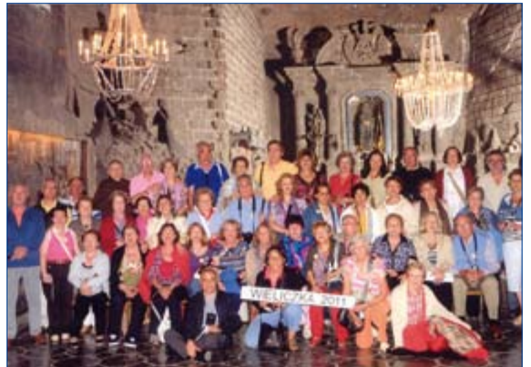
Peregrinos de la Diócesis en la mina de sal de Wieliczka, en Polonia, en una de las capillas excavadas en sal.