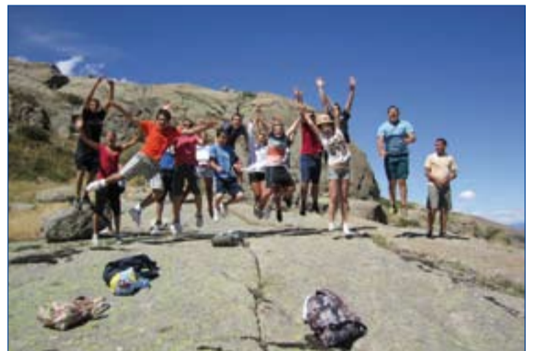
Algunos de los jóvenes que han participado en estas jornadas.

Por su parte, los jóvenes universitarios se han cuestionado la construcción de la persona, desde la dimensión de la afectividad y la sexualidad. La claves cristológicas han sido