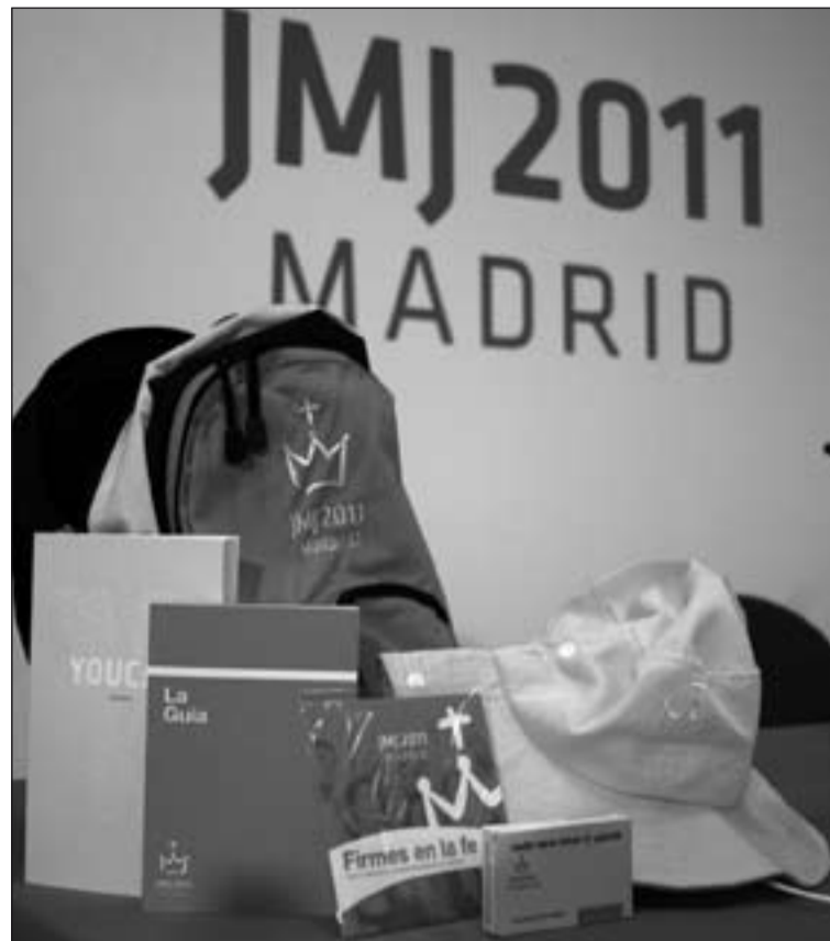
Mochila oficial de la JMJ con el material que contiene.

Martín Vallés también ha querido destacar que este hecho no supone un aumento del presupuesto municipal, "ya que la atención de esos colegios se realizará con el personal que cada mes de agosto trabaja en