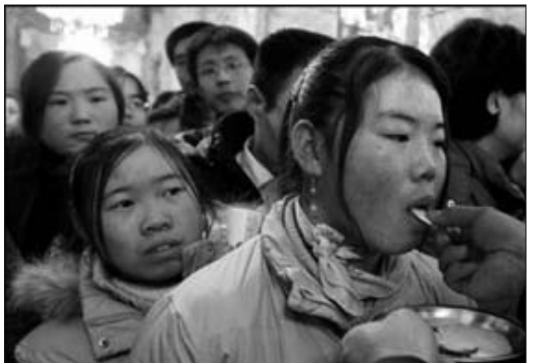
Católicas chinas reciben la comunión.