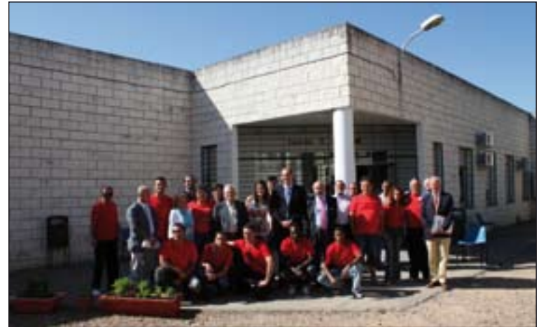
Autoridades, miembros de Cáritas y acogidos del Centro Hermano.