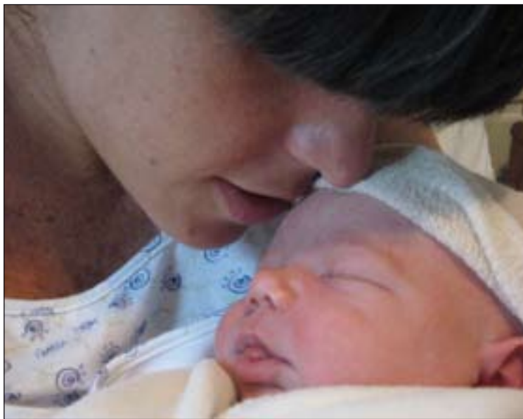
Excepto Irlanda, ningún país europeo tiene buenos datos en natalidad.

Con la caída de la natalidad en los últimos años, empie-