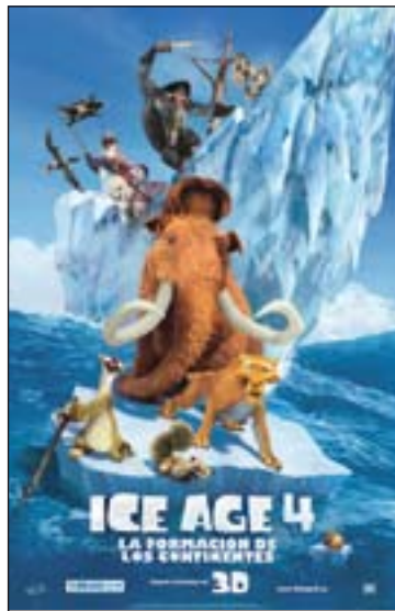
Cartel de la película.

El guión, que firman Michael Berg y Jason Funch, compone un relato que tiende más al público infantil que al adulto. Algo que en sí mismo no representa un defecto. Tal vez lo que más echemos en falta los mayores es que, pese a los valores que aborda de manera positiva, como el amor, la unión de la familia, la amistad y la solidaridad, a esta historia le falta el corazón de las anteriores. Algo que se debe, en parte, a la óptica, algo epidérmica, con la que aborda las cuestiones que trata, como por ejemplo