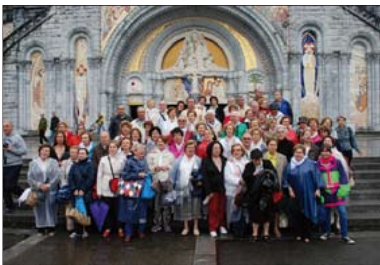
Participantes en la peregrinación en Lourdes.

Dentro del Turismo religioso, muy rico en contenido, los organizadores destacan la visita guiada a la Basílica del Pilar y el Templo de la Sagrada Familia y las Catedrales de