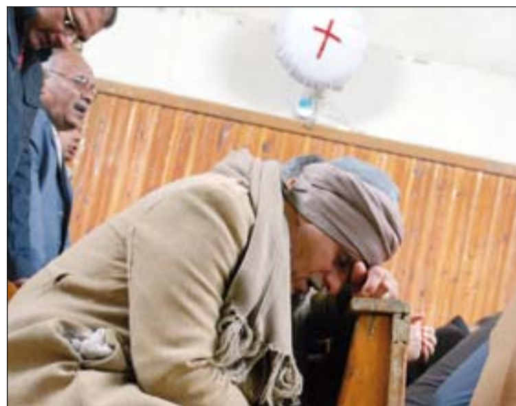
Cristiano egipcio orando.

Precisamente, el Papa Francisco advirtió que hay más cristianos perseguidos hoy