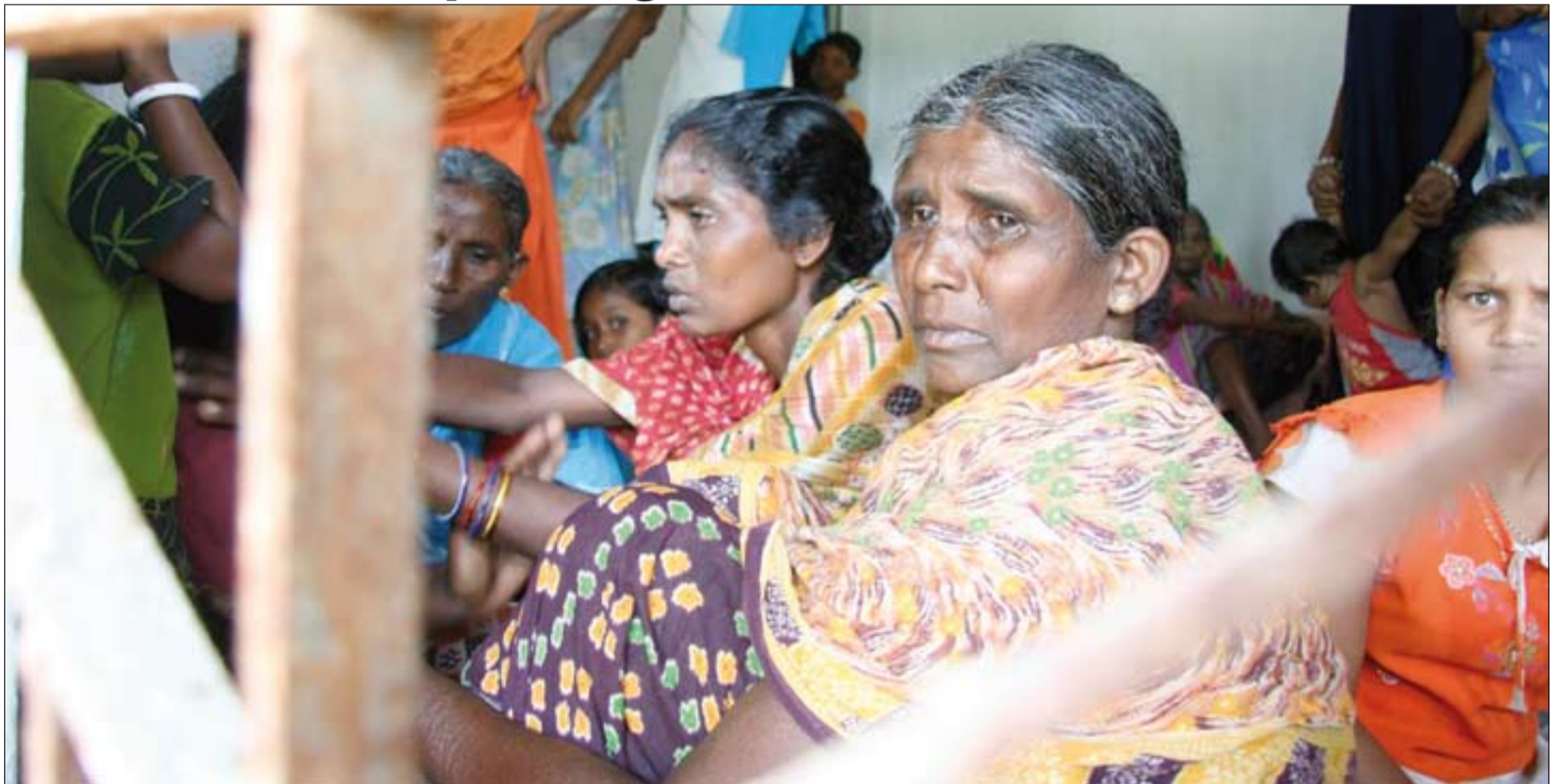
En la India, una mujer llora en un campo de refugiados cristianos.