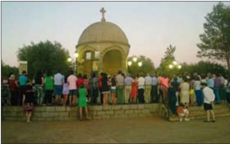
Participantes de la celebración del aniversario.