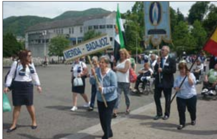
Peregrinos de la Archidiócesis de Mérida-Badajoz en el Santuario de Lourdes.

La Hospitalidad de Nuestra Señora de Lourdes de nuestra Archidiócesis de Mérida-Badajoz acaba de llevar a cabo un año más su tradicional peregrinación al santuario mariano francés. Ha sido entre el uno y el seis de julio, en la que este año han tomado parte 119 personas, entre enfermos y voluntarios.