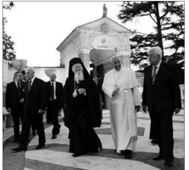
El Presidente Shimon Peres, el Patriarca de Constantinopla Bartolomeo I, el Papa Francisco y el Líder Palestino Mahmud Abbas, tras la oración de paz, el pasado 8 de junio

Para concluir, el Papa Francisco pidió a Dios: “haznos disponibles para escuchar el grito de nuestros ciudadanos que nos piden que trans-