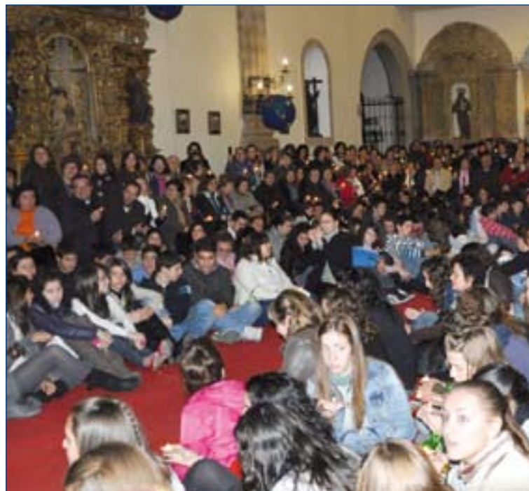
Jóvenes de Jerez de los Caballeros en la acogida de la Cruz de la JMJ.

Del 11 al 15 de agosto vivirán esta experiencia alternando acciones locales y de zona. Entre ellas habrá momentos de oración y celebración, de ocio y descanso, de turismo cultural y de fiesta, de encuentro con personas necesi-