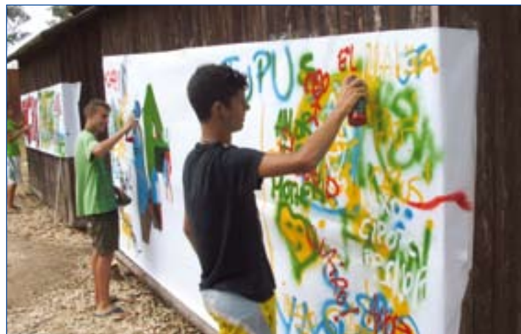
Jóvenes participantes en las actividades organizadas.

Las actividades que durante este mes se llevan a cabo son de diversa índole: deportivas, con un torneo de fútbol sala, que el domingo finalizó con las semifinales y finales, en el que han participado diariamente alrededor de 200 chavales; un torneo de ping-pong, en el que hay inscritos 22 jóvenes; una liga de fútbol sala matinal organizada por ellos mismos; recreativas, como excursiones a Matalascañas y Lusiberia; sociales, como la terraza de verano y la sala de juegos, donde los chavales se relacionan y amplían