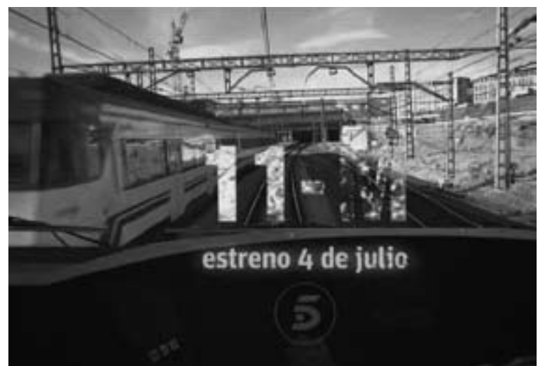
Anuncio de la TV-movie.

Desde mi punto de vista, ha sido un producto bien cuidado formalmente, aunque quizás no se debería haber incidido tanto en el punto de vista de los asesinos, ni tampoco en el componente religioso fanático. El mismo lunes por la noche escuché en un programa de radio una queja de una mujer musulmana, quien criticaba la visión extremista que se daba del Islam en este producto, así como el estigma que habían supuesto para ella los trágicos sucesos de en-