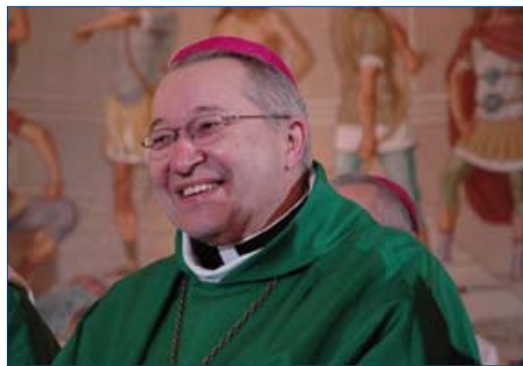
Cardenal André Vingt-Trois.

El Cardenal subrayó finalmente la importancia de ayudar a los jóvenes a comprender que su sexualidad y energía afectiva no constituyen simplemente un fenómeno hormonal sino que es algo constitutivo de la persona que debe crecer armoniosamente "y siempre al interior de una auténtica relación humana". ACI