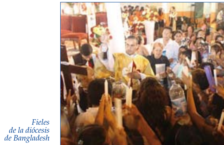
Fieles de la diócesis de Bangladesh

Sylhet es la séptima diócesis creada en Bangladesh, un país de mayoría musulmana en el que hay aproximadamente cer-