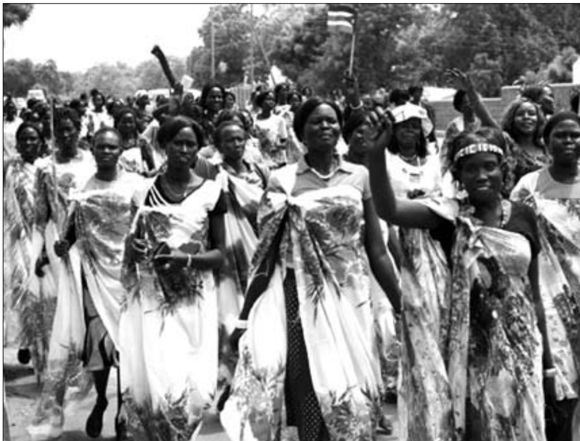
Mujeres de Sudán del Sur celebran la independencia

Tras la ceremonia oficial que registró oficialmente el nacimiento del Estado africano número 54, el pasado domingo tuvo lugar en Juba, la capital, una misa solemne en la que participó la delegación enviada por Benedicto XVI,