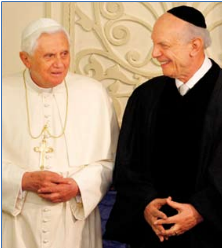
Benedicto XVI y el rabino Arthur Schneier.